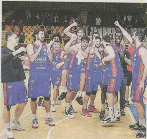
Un momento di esultanza della squadra di Montecatini che la prossima stagione giocherà in B Nazionale

Montecatini Con i verdetti emersi dalla tre giorni di finali alla Giuseppe Bondi Arena di Ferrara, domenica si è conclusa la stagione di serie B. Delle fantastiche quattro arrivate a contendersi le due promozioni in A2, a festeggiare sono state Vigevano - unica rappresentante del girone A delle due terminali - e Luiss Roma, a dispetto delle date per favorite Rieti (l'unica a perdere tutti e tre gli scontri diretti) e Orzinuovi, corazzata che ha eliminato la Fabo nel primo turno playoff e che nonostante le due vittorie su tre al pari delle promesse, è costretta a rimanere in B Nazionale a causa del quoziente canestri e di una formula cru-