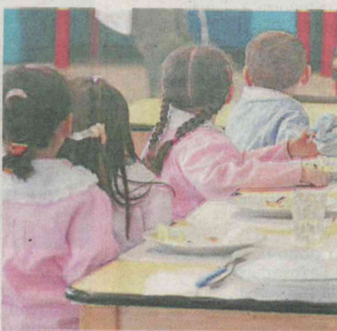
Una mensa scolastica: il servizio di refezione al centro della polemica a Monsummano, se ne discuterà nel consiglio comunale