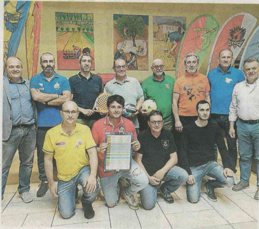
La presentazione del palio dei rioni