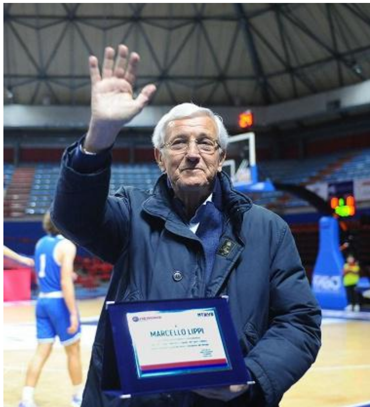
L'ex commissario tecnico della Nazionale campione del mondo, Marcello Lippi, presente ieri al PalaTerme per assistere alla gara degli Herons

Gara già indirizzata all'intervallo lungo Poi è ordinaria amministrazione