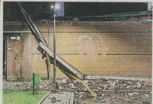
Nelle foto a sinistra la struttura con pesanti danni