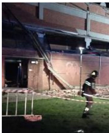
I danni all'impianto di piazza Pertini