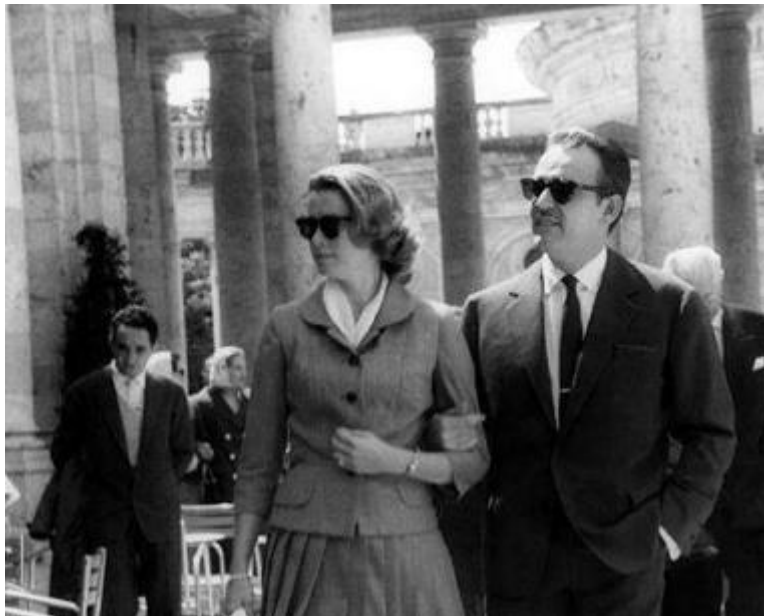
Grace Kelly e Ranieri di Monaco al Tettuccio