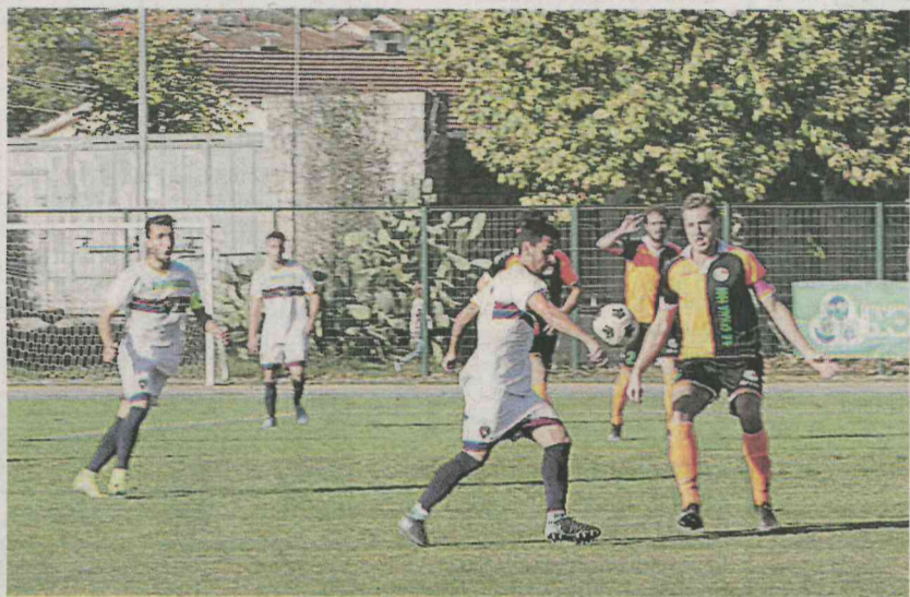
Il Camaioire Calcio in campo contro il Cenaia 1969 in una foto d'archivio

Locali sotto nel punteggio, ma subito in avanti alla ricerca del pari che arriva al 12': cross dalla destra di Cornacchia che trova la te-