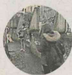
L'ingresso del liceo Salutati a Montecatini

Disagi per alcuni studenti, problemi all'impianto come avvenuto l'anno scorso