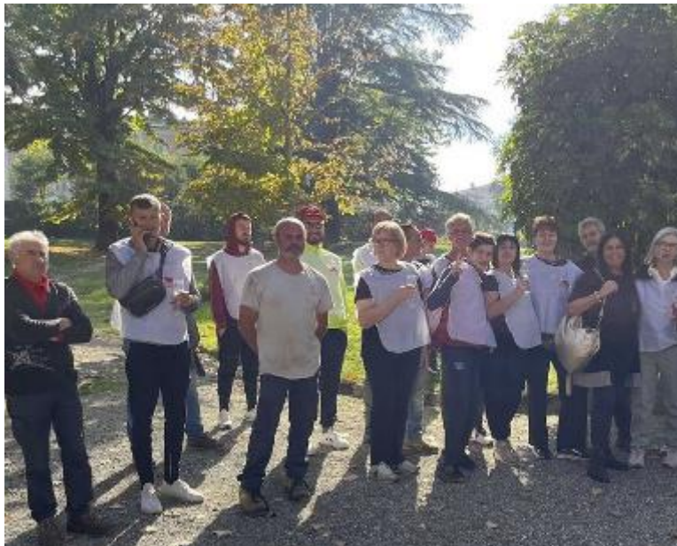
Una manifestazione di grande rilievo che guarda al futuro