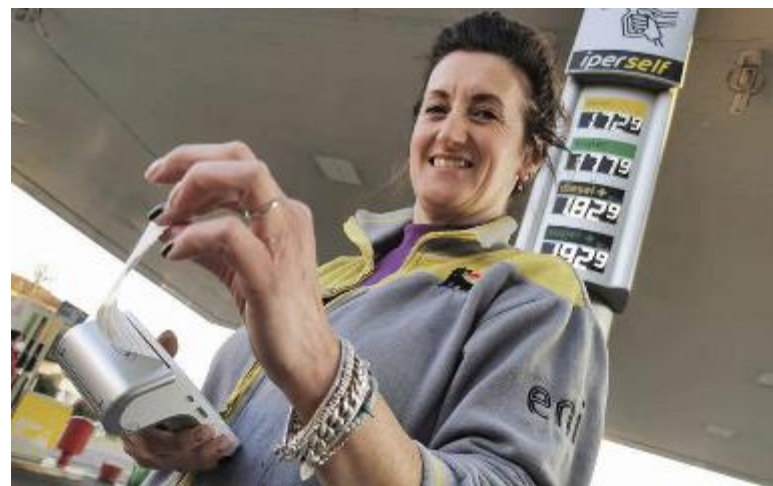
Una stazione di rifornimento: la mappa dell'Osservatorio

Dopo gli undici prezzi più bassi la graduatoria slitta sopra 1,750 e si incontrano tre pompe a 1,754: Eni e Q8 di via Dalmazia (gasolio rispettivamente a 1,744 e 1,704) e l'Esso di viale Adua (gasolio a 1,704). Nella fascia delle pompe con i prezzi più alti risultano, sempre secondo l'os-