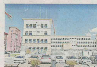
La questura di Pistoia, dove la donna è stata subito arrestata

Essendo la donna in stato di gravidanza, la procura ha disposto subito gli arresti domiciliari in attesa dell'interrogatorio davanti