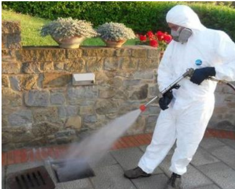
Un intervento di disinfestazione lungo una strada (foto di repertorio)