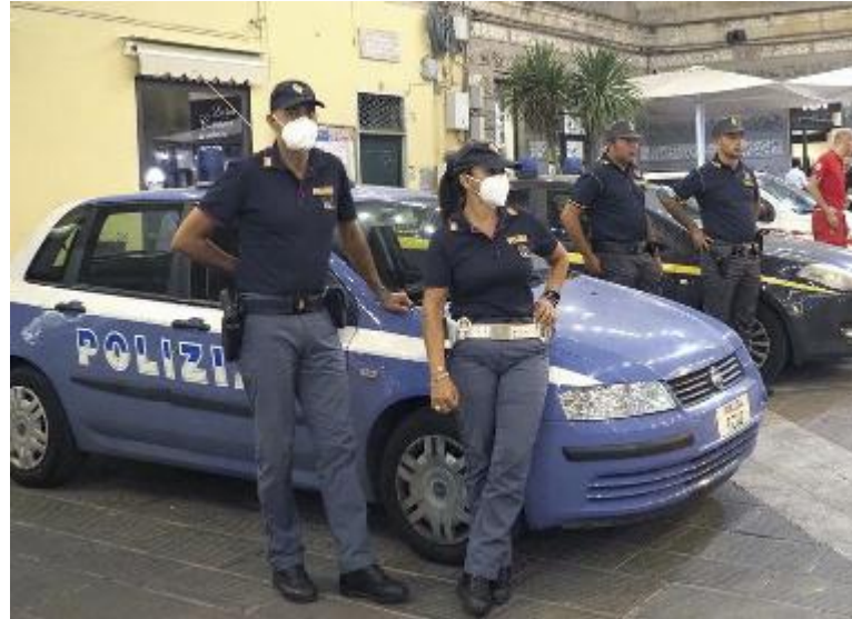
I controlli serali delle forze dell'ordine (foto d'archivio)

La sinergia tra il Controllo di vicinato e le forze dell'ordine ha permesso di riportare tranquillità, durante le ore notturne, nella zona di via Garibaldi, dove i clienti di un locale stavano facendo decisamente troppa confusione, sfociata in una violenta lite. È la stessa associazione a raccontare la vicenda. «Dopo la protesta per la malamovida – dice il gruppo in un comunicato – sono arrivati i controlli. È in questa occasione che il Controllo di vicinato ha chiamato il numero unico delle emergenze, segnalando musica alta e schiamazzi, culminati con una rissa. Alle 23, via Garibaldi sembrava una discoteca a cielo aperto, con musica alta proveniente da un locale ormai noto ai residenti, ma anche nel resto della città, visti gli episodi precedenti apparsi sul giornale. I residenti che fanno parte del progetto di sicurezza partecipata chiamato Controllo di vicinato, come sempre hanno segnalato il problema nella chat dedicata. Le prime regole