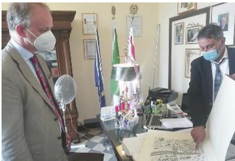
Eike Schmidt con Oreste Giurlani

«La scelta di Pescia come sede distaccata degli Uffizi è la certificazione di una qualità amministrativa importante». Lo dichiara Adriano Vannucci, capogruppo consiliare di Pescia Cambia, sull'onda dell'entusiasmo per la notizia emersa negli ultimi giorni. «Le dichiarazioni rilasciate alla stampa dal direttore delle Gallerie degli Uffizi di Firenze Eike Schmidt – continua – che indicano Pescia come una delle prossime cinque sedi distaccate di uno dei complessi museali più importanti al mondo, sono quelle pietre miliari che caratterizzano un percorso amministrativo e qualificano per sempre una città e il suo sistema culturale. Inutile sottolineare la nostra soddisfazione per un momento storico senza precedenti, che permetterà alla nostra città di compiere un ulteriore passo in avanti verso quella élite in ambito culturale e museale che è uno dei fiori all'occhiello di una amministrazione comunale che fi-