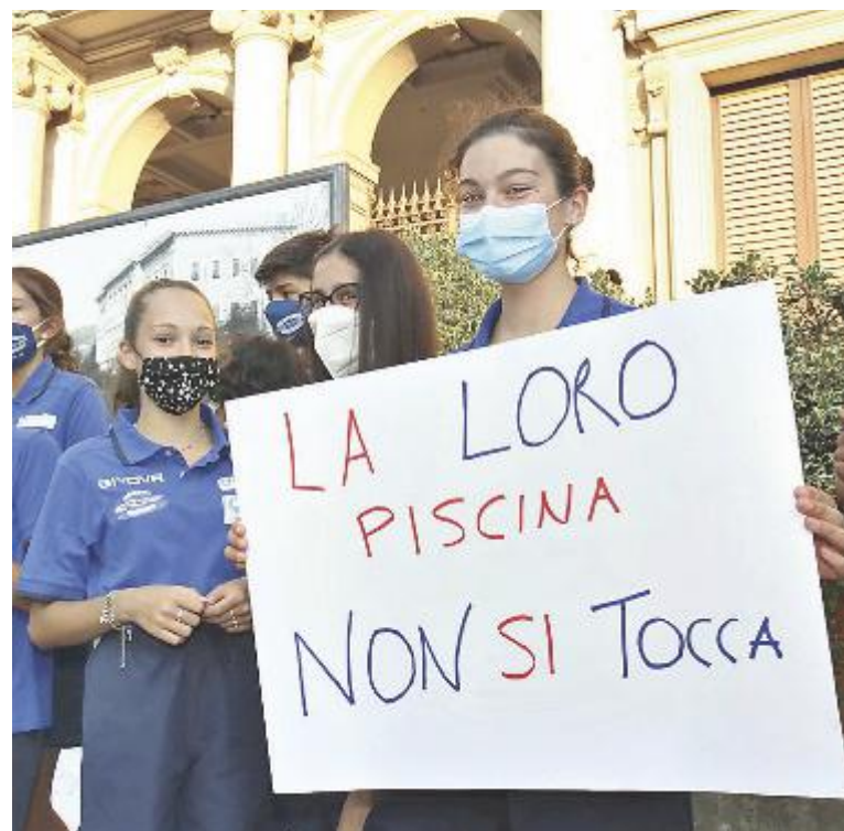
La protesta dei genitori contro il rischio di chiusura della piscina

sto dalla legge 77 del 17 luglio 2020. Il documento fa riferimento al periodo da giugno ad agosto, durante il quale la società ricorda di aver perso almeno 60mila euro, ai quali vanno sommati i soldi non incassati nel periodo di lockdown, dal 9 marzo al 6 giugno. Una richiesta in tal senso era stata presentata a gennaio, dopo il parere rilasciato dall'avvocato Franco Arizzi per il Comune, a giugno era stato fatto il punto della situazione e a settembre è stata presentata una nuova istanza che tiene conto della situazione venutasi a creare con il Covid-19. Nell'istanza, il Centro Nuoto Montecatini ha chiesto 70mila euro, un riequilibrio del piano finanziario con 60mila all'anno e il riconoscimento del fatto che le opere di manutenzione straordinarie siano già terminate. Il 7 settembre la giunta ha approvato una delibera di indirizzo dove viene dato incarico all'ufficio