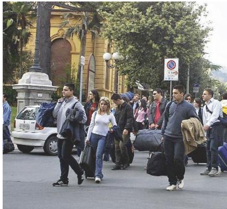
L'ultimo Dpcm non permette i viaggi d'istruzione

Un laboratorio per bambini dai 9 agli 11 anni si terrà sabato alle 10.30 alla biblioteca comunale Leandro Magnani di Montecatini Terme. L'evento dal titolo «Misteri in biblioteca...» è a cura Di Promo Cultura.