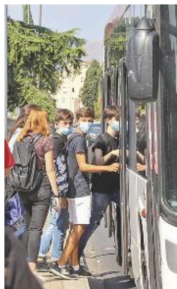
Sembrano invece risolti i problemi a Pescia riguardante gli studenti

devono risponderne?». Nei giorni scorsi c'erano stati invece lamentele giunte da Pescia per quanto riguarda gli autobus che trasportano gli studenti da e per le scuole. In alcuni casi c'erano stati casi in cui i pullman avevano lasciato a terra alcuni ragazzi a una fermata perché già pieni. Lo stesso sindaco Giurlani aveva scritto una lettera di protesta al consorzio del BluBus. Adesso, la situazione sembra tornata a livelli accettabili.