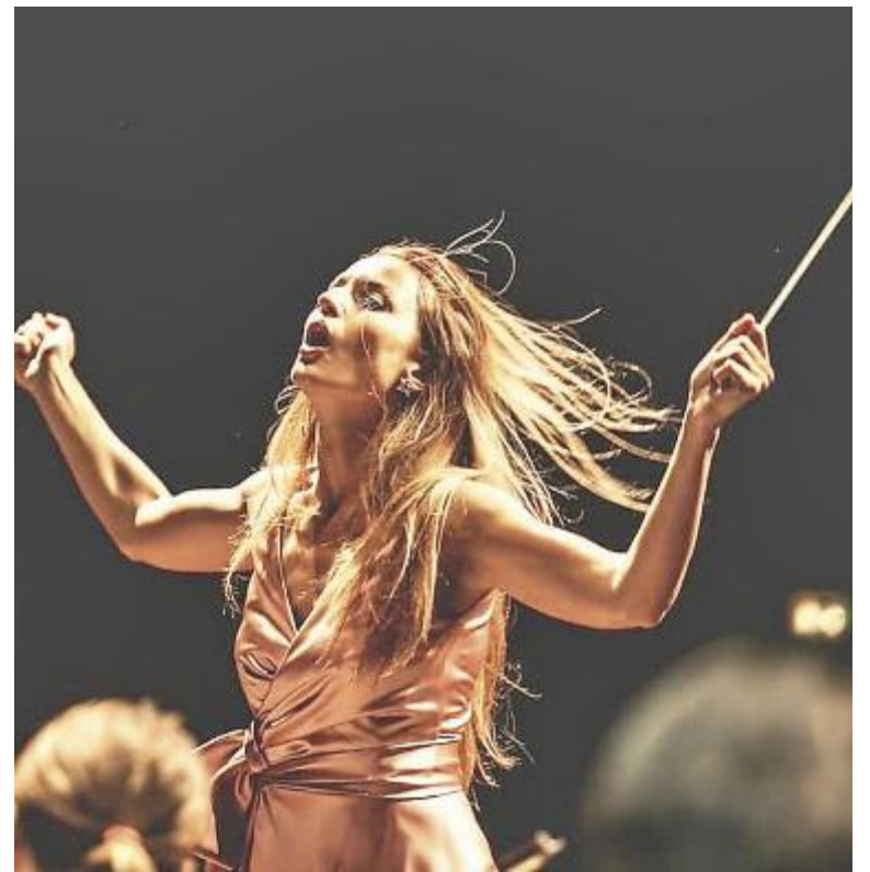
La direttrice d'orchestra Beatrice Venezi

«Non credo proprio che ci sia necessità di fare una distinzione di genere».