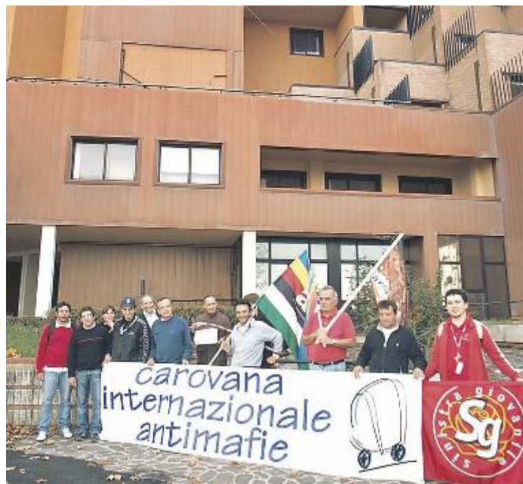
La Carovana Antimafie all'ex albergo Paradiso di Montecatini Alto

Codice giallo per temporali su gran parte della Toscana fino alle 12 di oggi. Lo ha emesso la Sala operativa unificata della Regione Toscana in conseguenza al permanere delle condizioni di variabilità perturbata sulla regione.