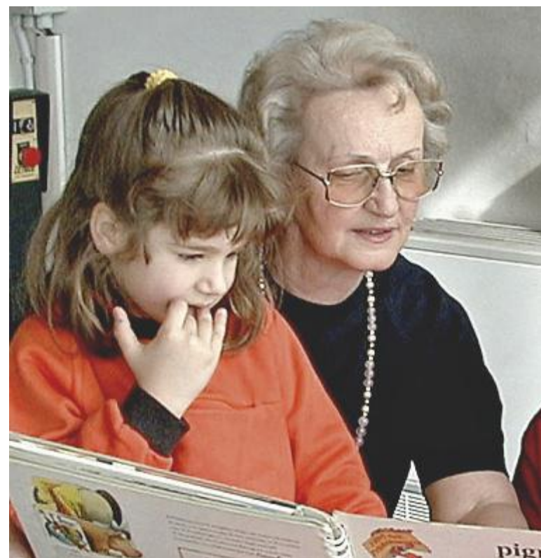
Una nonna legge un libro alla nipote (foto d'archivio)