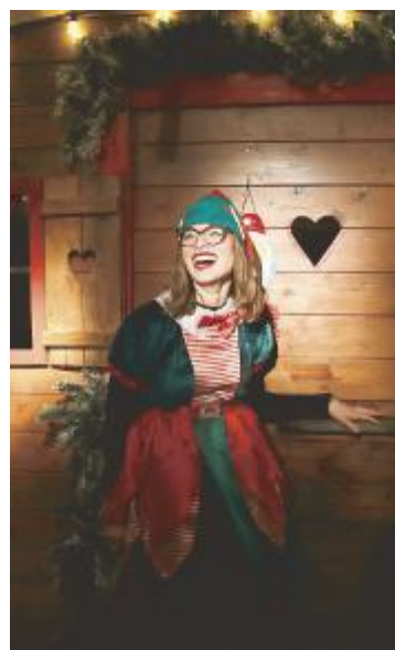
Un elfo protagonista di tanti eventi natalizi che si svolgono in città

eventi. Questo gruppo è coadiuvato da un gruppo di appassionati, studenti, tecnici, musicisti, poeti, pittori, scrittori, fumettisti, web designer, artigiani, giornalisti e uomini di pensiero. L'idea nasce dall'amore comune per l'arte». Il Comune, nelle scorse settimane, ha annunciato di aver investito circa 150mila euro nel nuovo Festival dell'inverno. E' già certo il ritorno della Casa di Babbo Natale alle Terme Tamerici e del Bosco degli elfi alla Salute.