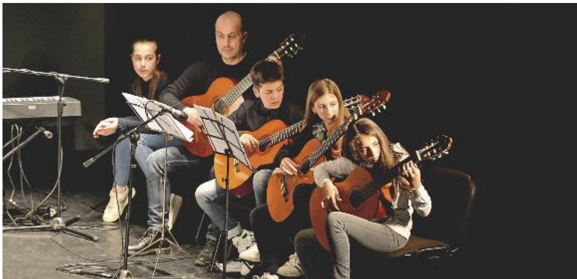
La premiazione di una delle edizioni passate di 'Far...rima nel mio sacco' con la partecipazione di centinaia di studenti