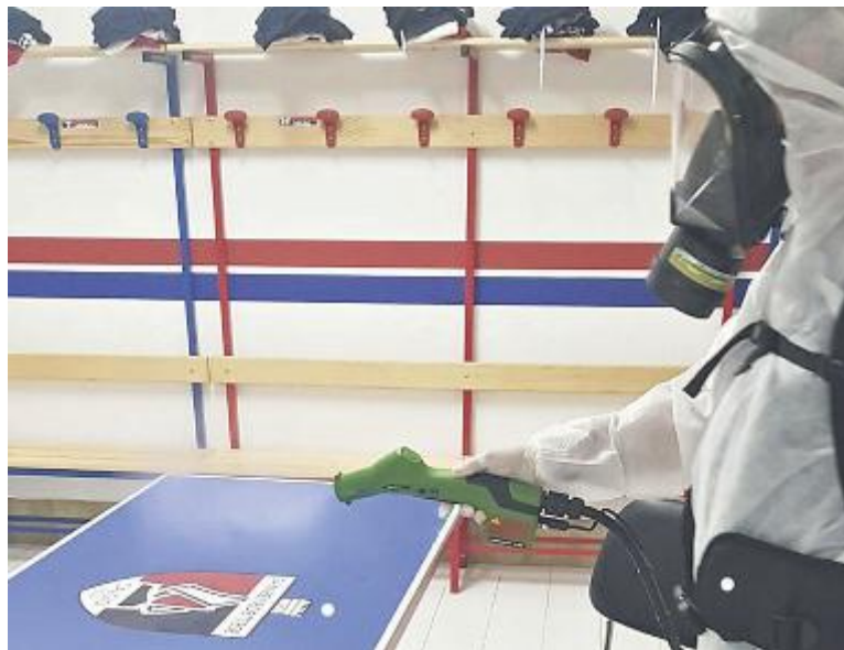
Un addetto igienizza un palazzetto dello sport (foto d'archivio)

«La quota è invariata dall'anno scorso per il settore giovanile e il minibasket»