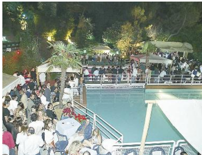
La piscina Panteraie prima della lunga chiusura. La struttura è adesso oggetto di un'ampia ristrutturazione da parte dei gestori