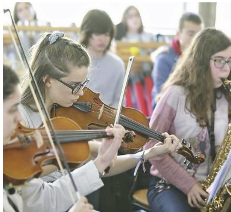
La bella iniziativa è finanziata dal Programma Erasmus dell'Unione Europea

Il laboratorio musicale utilizzerà gli strumenti digitali presenti su www.pinocchio.band per creare un video