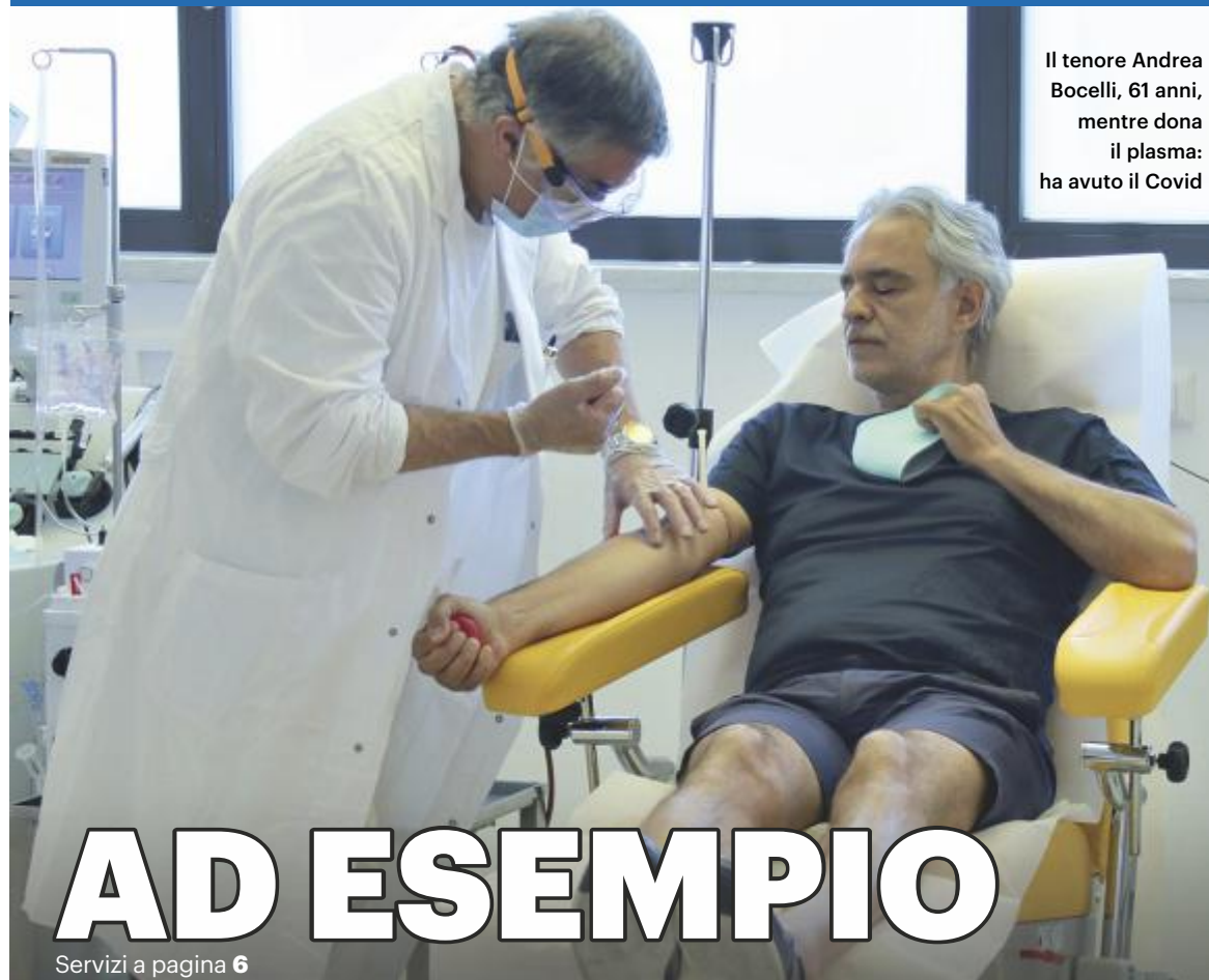
Il tenore Andrea Bocelli, 61 anni, mentre dona il plasma: ha avuto il Covid