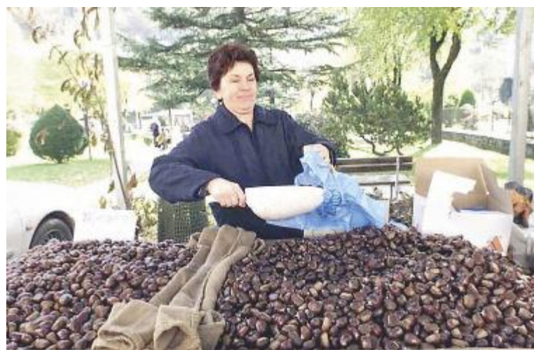
Il buon raccolto di castagne in autunno parte dalle giuste pratiche in questa stagione

« In questa stagione – spiega – i castagni stanno emettendo nuove foglie e nuovi getti e come ogni anno si parla dei danni prodotti dalle galle dovute al cinipide (Dryocosmus koryphillus). Dare una valutazione sulla presenza e sui danni prodotti dal cinipide del castagno richiede però un'analisi attenta della situazione e soprattutto il tener conto di aspetti specifici variabili da areale ad areale e di alcuni dati che i ricercatori cercano di render noti al mondo dei selvicoltori e degli appassionati è imprescindibile. In primo luogo va chiarito che l'introduzione del parassitoide Torymus sinensis (l'insetto buono che si nutre delle larve del cinipide) non può