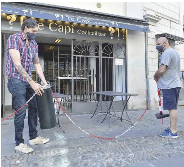
I locali della movida notturna si preparano a riaprire anche a Montecatini

«Dobbiamo dare esempio alla Toscana rispettando le regole anti-contagio»