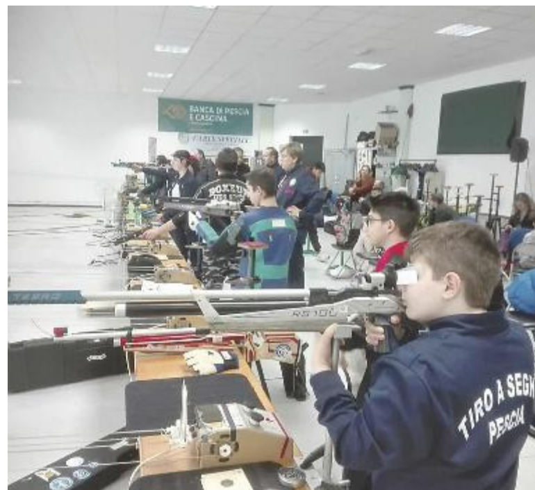
Giovani tiratori del Tsn Pescia: da domani possono tornare ad allenarsi