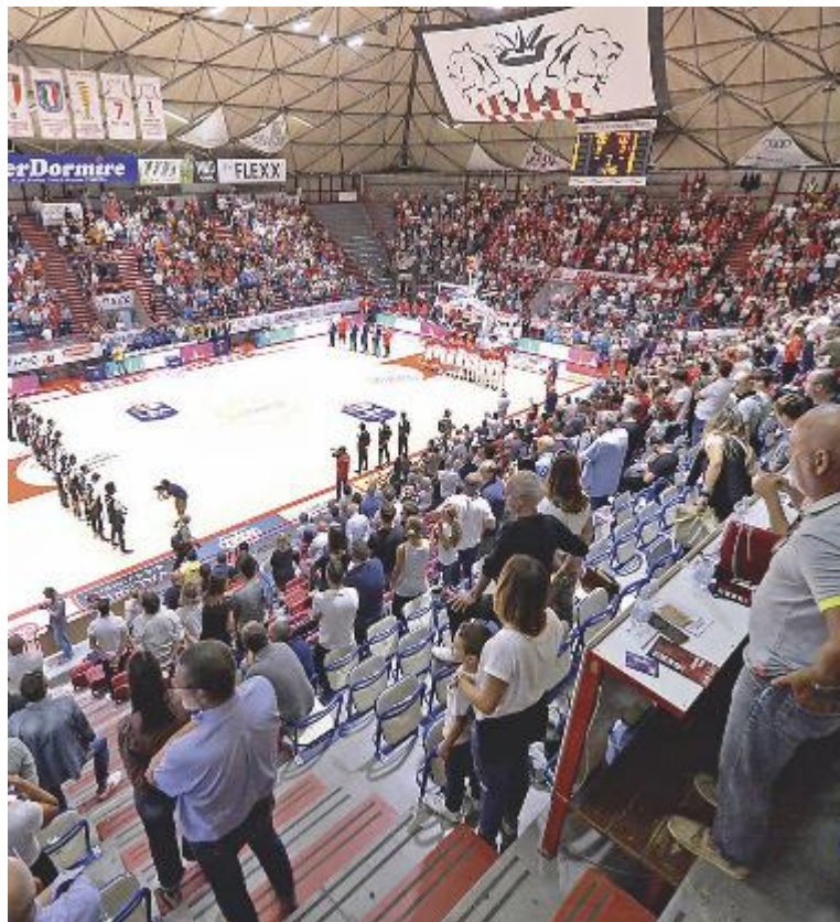
Il PalaCarrara in un'immagine di alcuni mesi fa

Entro il 15 giugno Pistoia dovrà decidere se continuare in A1