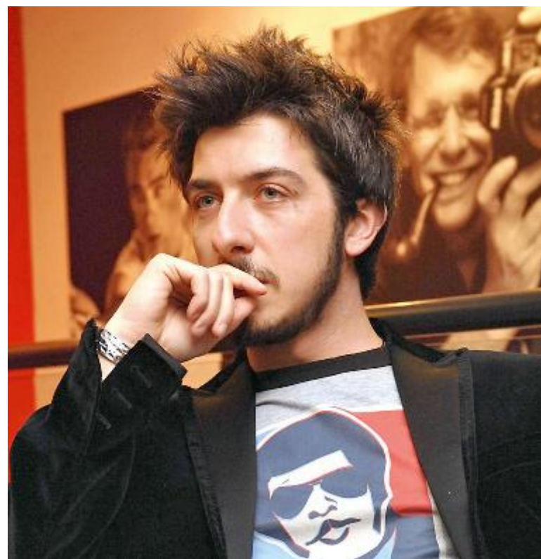
L'attore Paolo Ruffini, è nato a Livorno il 1978

to gente che mi vuole bene e mi capiscono se vado in crisi, vorrei esternare questa situazione a tutti per far capire cos'è la dislessia e far sapere che il teatro mi ha aiutato tanto. Il mio sogno è fare un film con Paolo Ruffini». Intanto, mente la scuola on line non riesce, a quanto pare, a essere all'altezza di portare avanti anche i programmi per dislessici, a correre incontro alla richiesta di Leonardo è stata Alessandra Paganelli, attrice che ha fondato su facebook il gruppo Vips e che ha coinvolto Leonardo e altri ragazzi in un video. «Io sono dislessica e sono un'attrice - spiega Paganelli - Non mi sono mai occupata però di questo tema in ambito teatrale. Quando Leonardo ci ha contattati, ho voluto provare a fare qualcosa, coinvolgendo anche altri ragazzi dislessici. Abbiamo pensato di sfruttare questo periodo in cui abbiamo tutti più tempo nel-