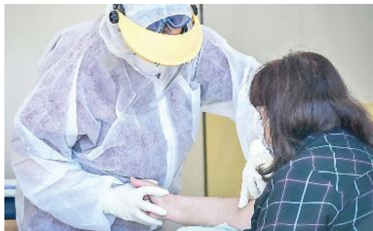
Gli esami sierologici saranno effettuati nelle regioni su un campione di cittadini

Quanto alla gara per i 150mila test il decreto, oltre ad aggiudicare la fornitura alla Abbott, prevede che «si dia avvio alle verifiche del possesso dei requisiti dichiarati in gara» dall'azienda e stabilisce di «procedere alla stipula del relativo contratto». «Quella vincente - ha spiegato il commissario per l'emergenza, Domenico Arcuri - è la migliore soluzione oggi esistente sul mercato. Non esistono test affidabili al 100%, ma il nostro bando di gara richiedeva il 95%,