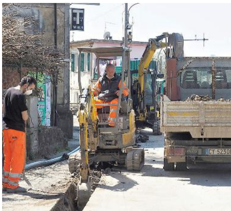
Il gestore idrico ha ultimato la realizzazione delle condutture in corso Matteotti