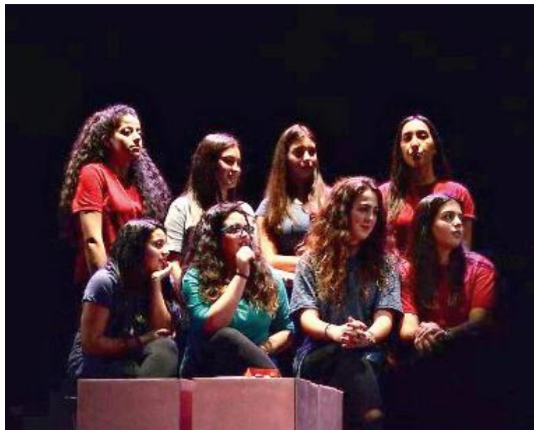
Giovani partecipanti alle iniziative «Teatro & Scuola» di Mimesis

Le sue parole costituiscono la fonte di ispirazione di chi vorrà cimentarsi