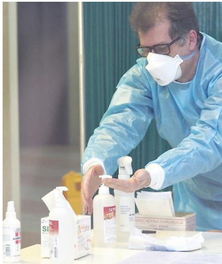
Un medico di malattie infettive si disinfetta le mani (Foto archivio)

Ieri la giornata più nera anche per i contagi a Pistoia e Provincia: 22 in sole 24 ore. Ma nessuno dei nuovi pazienti è in gravi condizioni. Il bollettino regionale martedì ne contava 100 in totale nella Provincia, ieri sono diventati 122. Fino a martedì il numero più alto di contagi in un solo giorno era stato 16. Ieri è arrivata la rapida impennata, dopo che nei giorni scorsi il numero dei contagi si era attestato sui dieci di media al giorno. Per quanto riguarda gli ultimi casi: 14 persone sono state ricoverate (12 al San Jacopo e 2 a Careggi), mentre 7 pazienti sono in quarantena nella propria casa. Fra i nuovi ricoveri al San Jacopo ci sono un uomo di 71 anni di