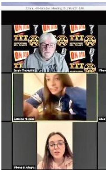
Il Volley Aglianese si allena in video