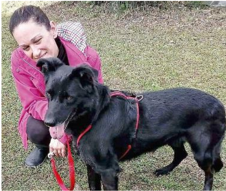
Volontarie del canile Hermada con due bellissimi ospiti della struttura di via delle Padulette

Non c'è carenza di cibo grazie alle donazioni di privati e di Unicoop