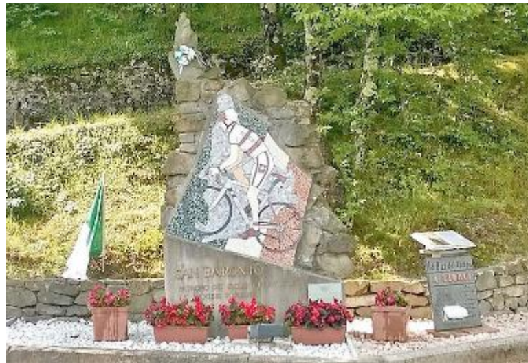
Il monumento che sorge al culmine della salita di San Baronto