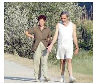
A passeggio lungo i fiumi