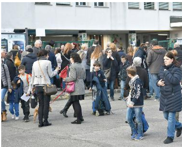
Nell'area ex Kartos potrebbero essere riunite diverse scuole cittadine