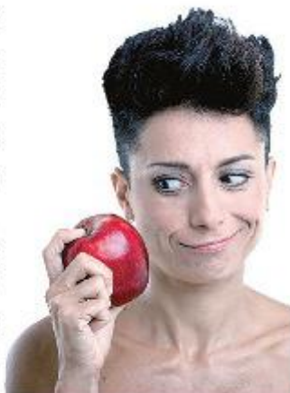
L'attrice Rita Pelusio

V enerdì 15 novembre alle ore 21.00 Rita Pelusio approda al Teatro Buonaprima con “Eva, diario di una costola” per dare vita a una figura curiosa e ribelle che si affaccia al mondo con uno sguardo puro. Ispirato al “Diario di Eva” di Mark Twain, Eva è un clown, un fou irriverente che si trova alle prese, prima della storia, con la più grande scelta dell'umanità: accettare le regole o disubbidire. In un misto di consapevolezza e disincanto, Eva si chiede cosa succederà dopo, proiettandosi nella contemporaneità delle donne di oggi. Dalla suora in crisi mistica alla madre di figlio maschio, dalla manager multitasking all'anziana innamorata.