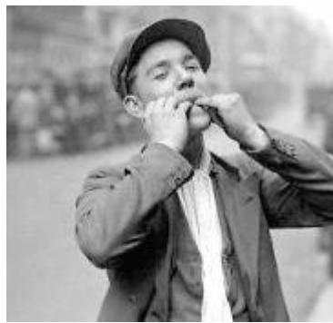
Fischiare (foto di repertorio)

Nello spazio Art Corner, a partire da oggi, arriva Andrea Dami con la mostra 'Panta rei'. Sei fotografie a colori su carta attraverso cui prendono vita i pensieri e le sensazioni che l'artista ha catalogato nella sua memoria per poi tracciarne su carta gli aspetti più interessanti o più emotivi. Andrea Dami si è diplomato all'Istituto d'Arte di Pistoia e dal 1963 ha partecipato a premi e mostre. Dal 1966 ha realizzato anche scenografie, videoinstallazioni e video. La mostra sarà inaugurata oggi alle 17 e sarà visitabile fino al 15 gennaio 2020.