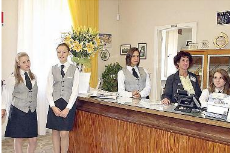
Studenti dell'istituto alberghiero alla reception della Querceta