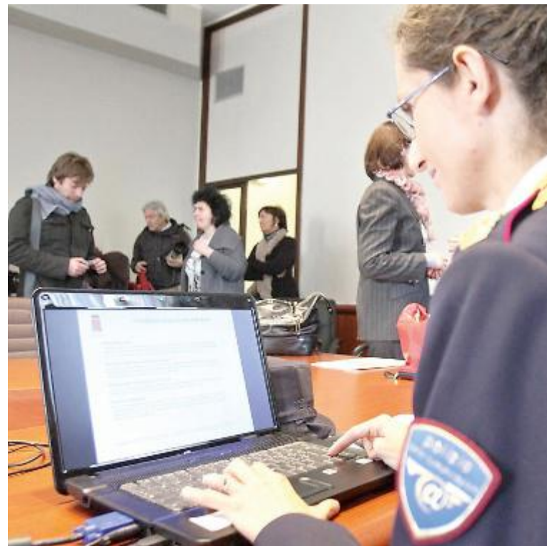
Il cyberbullismo è un fenomeno in crescita costante

ia è un contesto ricco di iniziative che aiutano lo sviluppo e la coesione delle comunità locali, ma è forte l'esigenza di ricondurre questi piccoli segni all'interno di un più «grande disegno» capace di contrastare efficacemente la povertà educativa, massimizzando l'impatto delle iniziative locali e creando una rete solida di comunità ad alta densità educativa capace di condividere esperienze, pratiche e metodologie di approccio ai problemi». «Digi-