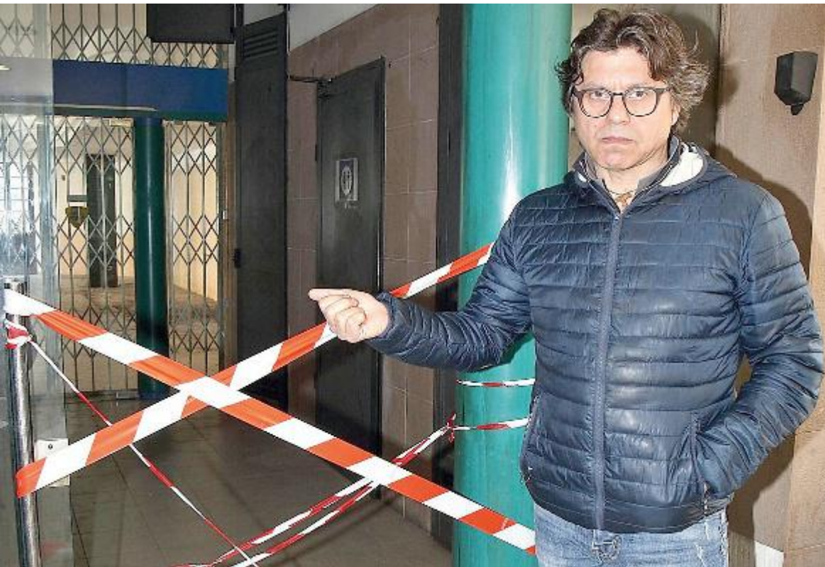
La porta non c'è più, molto probabilmente vittima dell'ennesimo atto vandalico alla stazione del centro

CONTO alla rovescia per il primo contest nazionale Best Barista Junior. L'istituto Alberghiero Martini di Montecatini pensa in grande, estendendo il concorso da gara locale (giunta alla terza edizione) a nazionale. Due le giornate in programma: 4 e 5 aprile 2019. Due i filoni di gara. Per quanto riguarda la caffetteria: quattro caffè espressi perfetti e due cappuccini a regola d'arte; preparati con un corretto set up ed utilizzo degli strumenti della caffetteria. Per quanto riguarda la mixology è prevista la realizzazione di due fantasy drink a base di caffè, preparati con estro e fantasia. Ma anche corretto rispetto dei dosaggi ed utilizzo attrezzature.