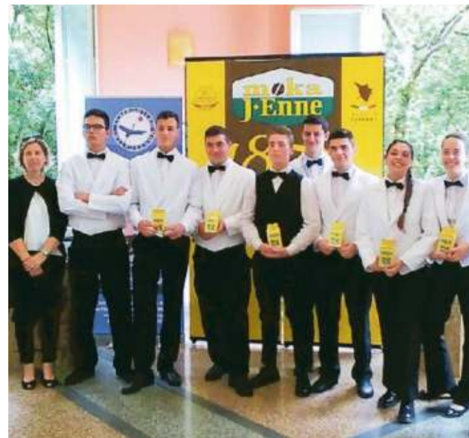
Alcuni partecipanti dell'Alberghiero alla passata edizione

Le scuole che partecipano al primo contest "Best barista junior" arrivano da tutta Italia: Ipssea Savioli Riccione, Ipsar Datini Prato, Ist. Nino Bor-