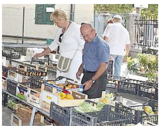
Rimane in funzione solo il «Mercato della terra»