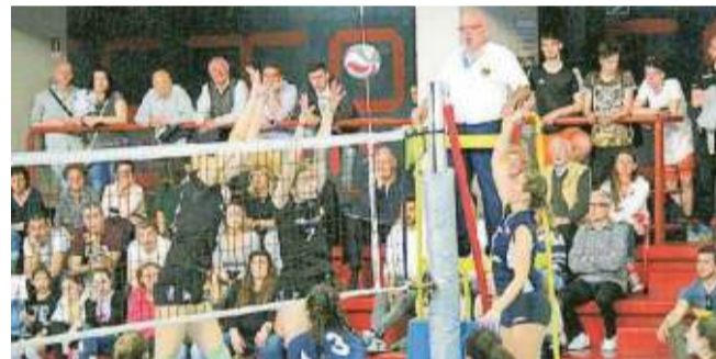
Un'azione di gioco dell'Ariete Project Prato