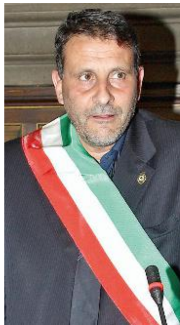
ORESTE GIURLANI Sindaco di Pescia

protocolli previsti. Anche volendo, non abbiamo potuto in quella circostanza riservare posti per dializzati o donatori, perché il codice della strada non lo prevede, limitandosi ai soli disabili o invalidi. Il problema comunque non vogliamo certamente eluderlo e, visto che stiamo lavorando per tornare in possesso dei parcheggi, una volta che questa situazione sarà definita, una delle prime operazioni sarà certamente riservare dei posti proprio ai dializzati e ai donatori di sangue. Non è possibile invece intervenire nella ex-filanda, semplicemente perché non siamo noi titolari della proprietà della struttura che appartiene alla Asl. In conclusione, per quanto ci compete, faremo sicuramente tutto il possibile per venire incontro alle legittime esigenze di queste persone».