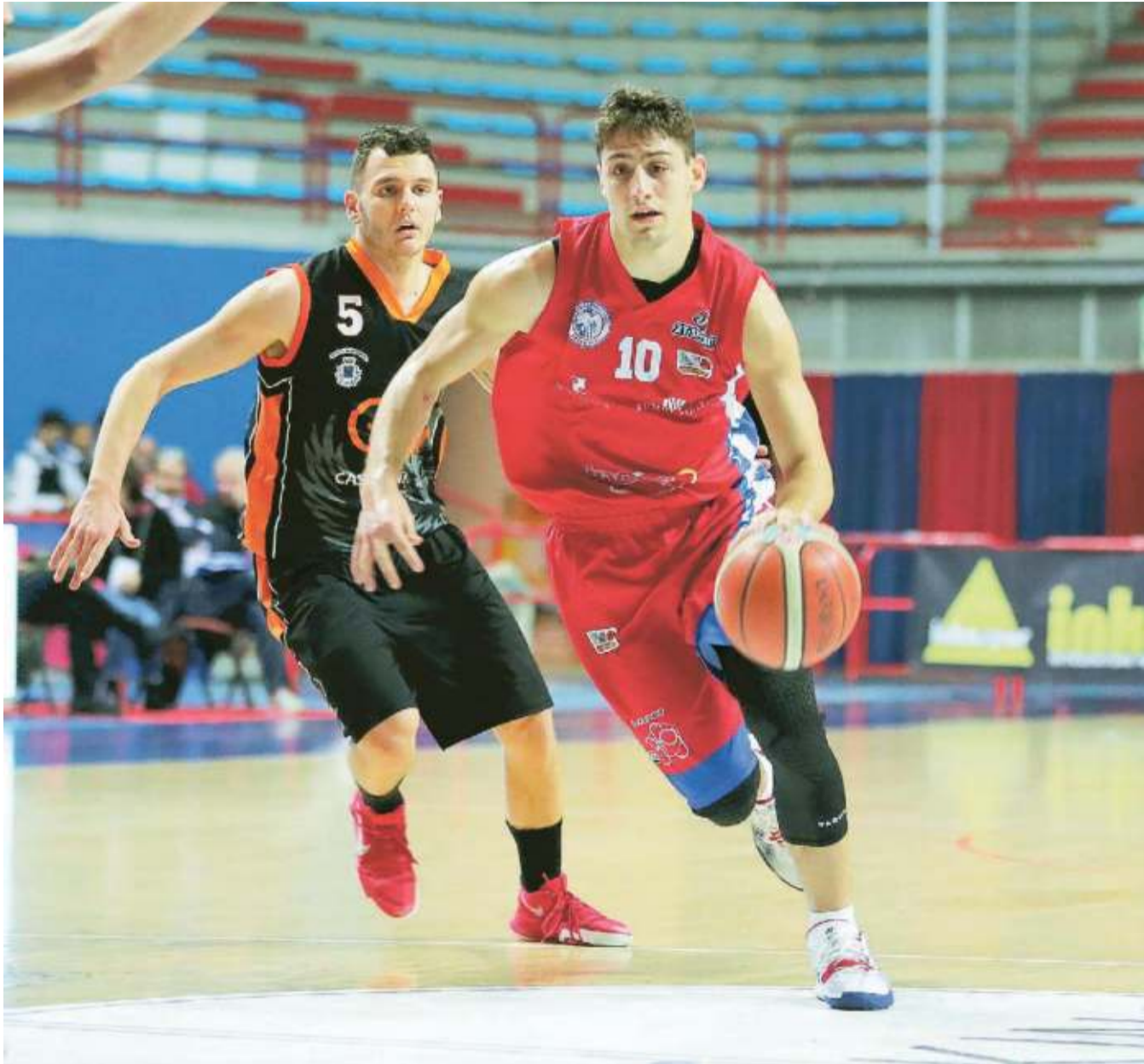
Glali, decisivo anche nella vittoria di Borgosesia