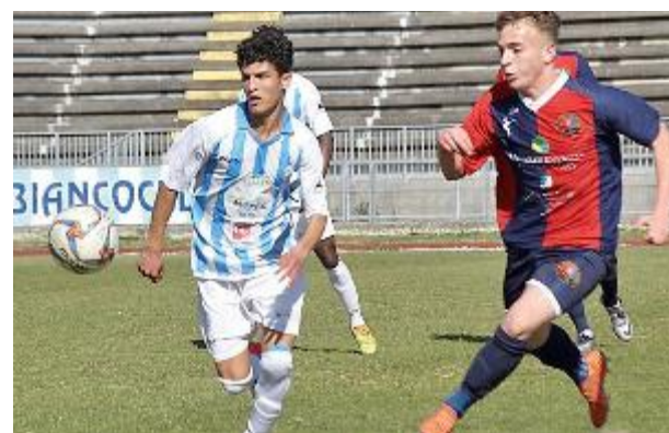
TRASFERTA INFRUTTUAOSA Montecatini ko