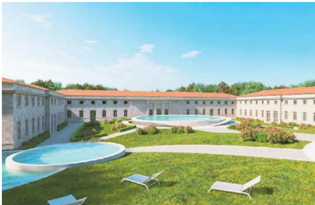
Il rendering dell'esterno delle Leopoldine: a sinistra una delle due piscine più piccole

Due le opzioni proposte dalla joint-venture formata dal fondo d'investimento americano York Capital e dall'italiana Feidos. La prima prevede l'utilizzo di volumetrie anche al di sotto della collina che si affaccia sul lato Tamerici (con collegamenti sotterranei, giochi e cascate d'acqua); la seconda si concentra invece sul solo terrapieno esterno. In entrambe le ipotesi l'edificio storico è destinato all'accoglienza della clientela, bar, negozi, spogliatoi, magazzini, impiantistica, locali per lo staff, oltre che ad aree relax e wellness. Sull'ala sinistra della struttura si segnala la possibilità di realizzare un ambulatorio con ingresso indipendente.