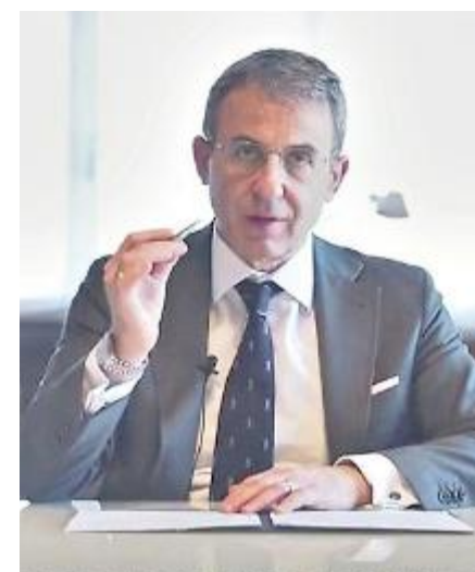
Il ministro Sergio Costa. I grillini di Buggiano seguono le sue direttive

Sposato con un figlio, vive a Pescia ma è nato a Pieve a Nievole dove ha lo studio. E' perito per il tribunale di Pistoia e consulente per la sezione antimafia di Firenze per i beni confiscati