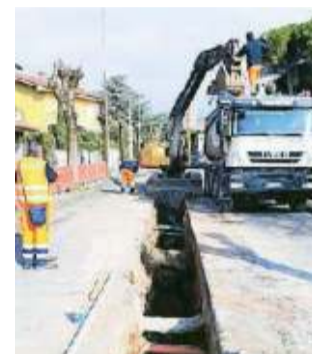
I lavori in via Volturmo

L'intervento ha comportato un investimento superiore ai 220 mila euro e ha permesso la sostituzione della tuba-