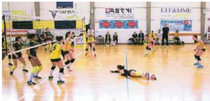
La Timenet Empoli battuta dalla capolista Macerata