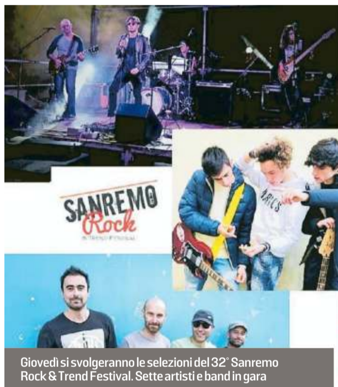
Giovedì si svolgeranno le selezioni del 32° Sanremo Rock & Trend Festival. Sette artisti e band in gara