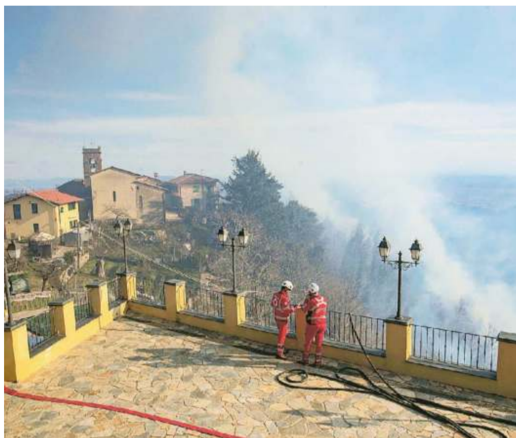
Il fronte dell'incendio sotto il paese di Avaglio e sulla destra il Canadair dei vigili del fuoco mentre scarica tonnellate d'acqua sulle fiamme

L'allarme è scattato poco prima delle 13,30. Quando il fumo è stato avvistato dalla gente della piccola frazione montana del comune di Marliana. Il tempo del passaparola per avvertire tutti, e le fiamme erano già alle porte del paese. Mentre alcuni abitanti si sono armati di sistole per bagnare i giardini delle case più a rischio, i primi ad arrivare sono stati i vigili del fuoco di Montecatini, una cui squadra si trovava già a metà strada, a Marliana, per un albero abbattuto dal vento su una casa (altra dose di fortuna). A seguire, le squadre anche da Pistoia, Prato e Lucca, la protezione civile con Croce rossa e Vab, gli uomini dell'Unione dei Comuni della montagna pistoiese, i carabinieri di Marliana. E lo