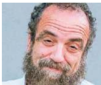
Giobbe Covatta è il protagonista dello spettacolo "Giobbe" in programma sabato 30 marzo al Teatro Nazionale

QUARRATA. Il 30 marzo chiude la stagione del Teatro Nazionale di Quarrata un'anteprima della scena italiana: "Scoop", di e con Giobbe Covatta. Lo spettacolo parte da una domanda: "Esistono razze superiori o razze inferiori?". Giobbe Covatta, con il suo modo comico e graffiante, ma al tempo stesso tenero e accattivante, racconta il punto di vista di "eminenti personaggi". —