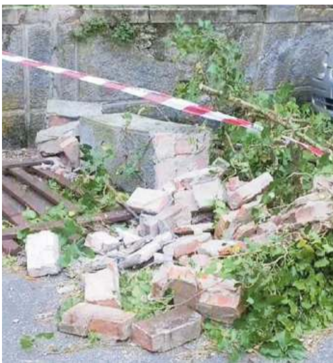
Un particolare del crollo di parte della recinzione delle Terme Torretta, con i detriti che si sono riversati lungo la via Baragiola

In particolare, l'anemometro della stazione della rete Meteonetwork di Santomato ha registrato una raffica ragguardevole di 117 chilometri orari. —