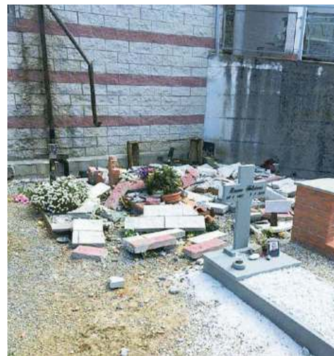
Mattonelle e calcinacci ammassati sopra alcune tombe del cimitero di Montecatini dopo essersi staccati dal muro