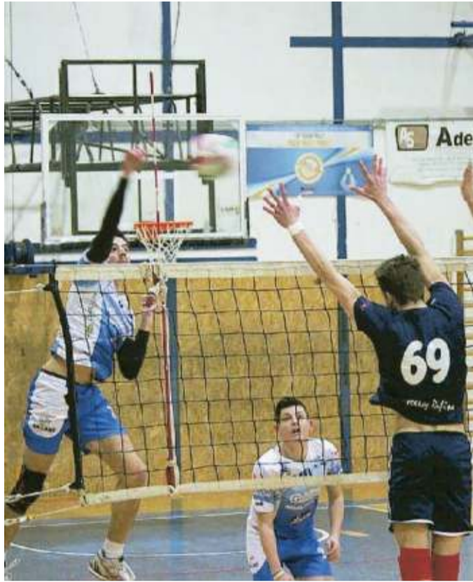
Una schiacciata dei ragazzi del Vaiano Volley