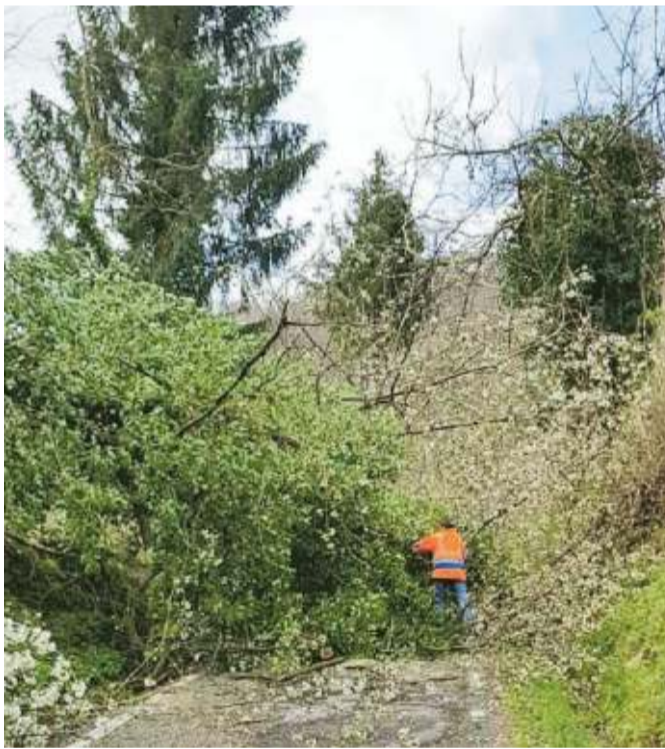
Personale del cantiere comunale di Pistoia al lavoro per liberare una strada di collina da uno degli alberi abbattuti dal vento