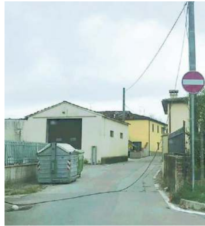
Il cavo elettrico dell'Enel caduto per strada a Masiano: un'altra delle emergenze provocate dalle forti raffiche di ieri mattina