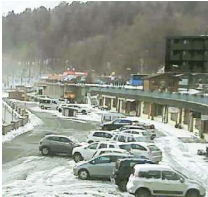
Auto imbiancate nel parcheggio del campo scuola all'Abetone

A Quarrata è stata danneggiata dal vento nella notte tra lunedì e martedì la pensilina all'ingresso della scuola elementare "Don Giuseppe Puglisi" di via Santa Lucia a Quarrata. Le due lastre della copertura colpite dalle raffiche sono state rimosse nella