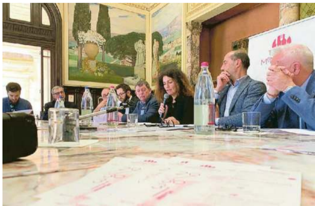
La presentazione di "Tasting Montecatini" ieri mattina al Caffè storico del Tettuccio