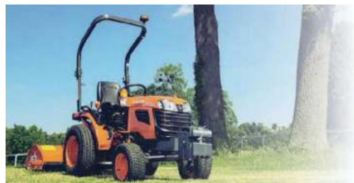
Kubota B1121: Il trattore compatto per tutte le lavorazioni (con omologazione stradale)