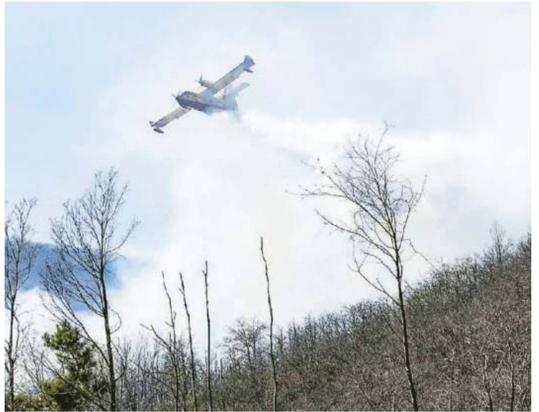
Il passaggio di un Canadair nelle operazioni di spegnimento dell'incendio di sabato a Stiappa