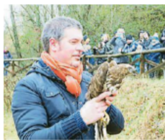
Domenica all'oasi di Arnovecchio sarà possibile assistere alla liberazione di alcuni rapaci

EMPOLI. Sarà un'occasione unica, tutta da vivere in perfetta sintonia con la natura ad Arnovecchio, un'oasi naturale protetta dove, domenica alle 10, verranno liberati alcuni esemplari di rapaci. Una liberazione pubblica organizzata dal Centro Rdp Padule di Fucecchio, che gestisce l'area per conto del Comune di Empoli, in collaborazione con Legambiente Empolese-Valdelsa. —