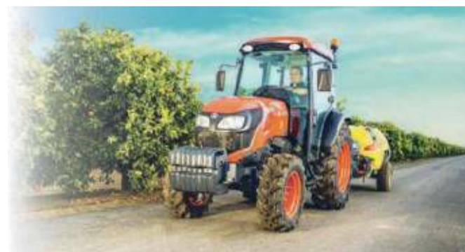
La scelta giusta per i tempi moderni Kubota M5001 Narrow

Tel. 0583 48555 viale Carlo del Prete, 347/C Lucca Tel. 0583 276197 via Romana, 170 - loc. Gossi - Montecatini (LU)