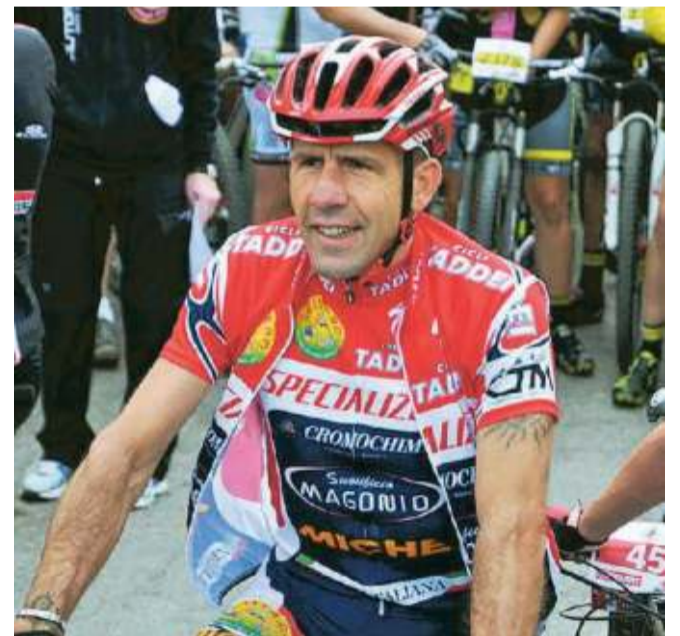
Francesco Casagrande a una granfondo

della manifestazione di quest'anno Francesco Casagrande , ex ciclista su strada e biker italiano. Professionista dal 1992 al 2005 su strada, dal 2009 nuovamente attivo nella mountain bike a livello amatoriale. «Sono felice che sempre più spesso si organizzino delle giornate dedicate allo sport e lo si faccia con autentico spirito sportivo», ha sottolineato Casagrande.