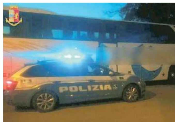
Il bus carico di studenti fermato dalla Polizia stradale

I conducenti hanno soffiato nell'etilometro e uno di loro è risultavo positivo, con un tasso di alcool nel sangue pari a 0,66 g/l. Lui ha provato a giustificarsi dicendo che aveva bevuto appena un goccino, ma i poliziotti sono stati inflessibili, facendogli notare