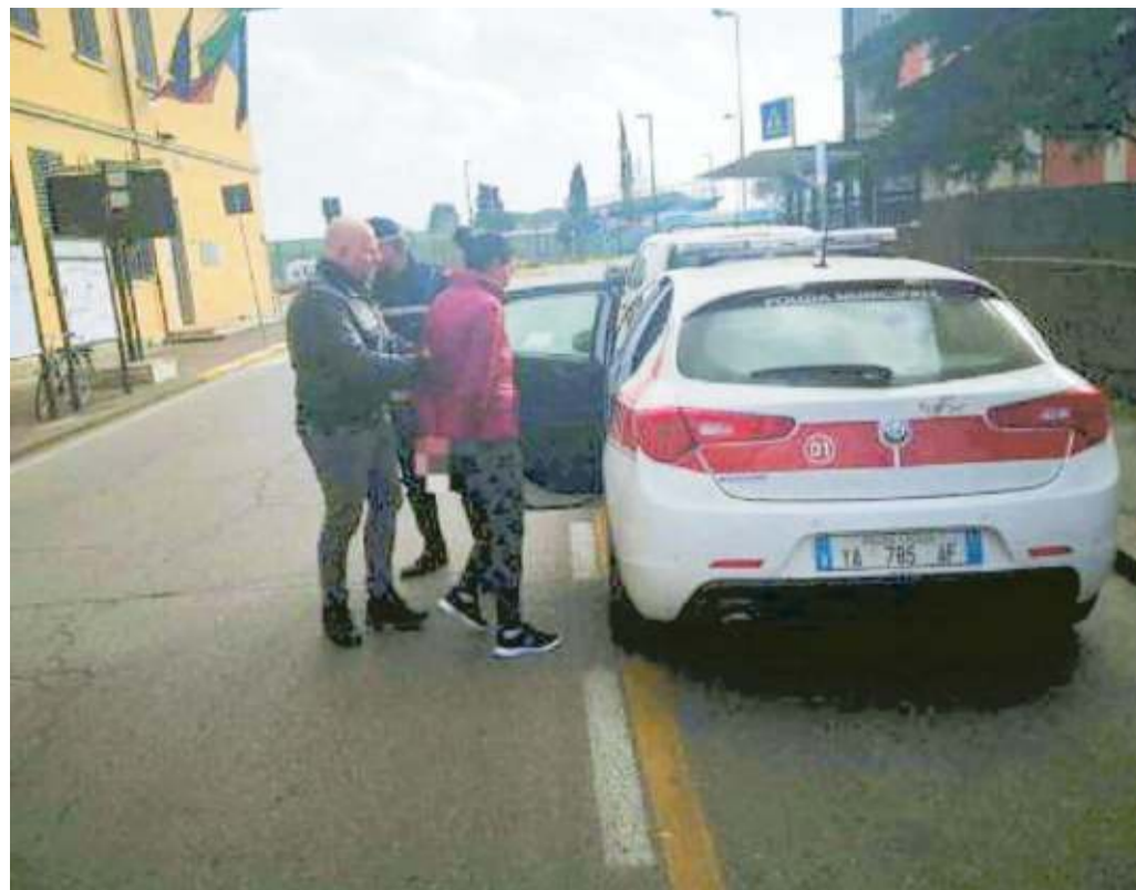
La borseggiatrice mentre viene portata via dal mercato di piazzale Leopoldo

Come però stavano facendo con lei gli uomini della polizia municipale in borghese. Fatto sta che con una maestria non comune, la donna era riuscita a sfilare le banconote dal portafoglio senza che nessuno se ne accorgesse, per poi nascondersi dietro uno dei furgoni del mercato e infilarselo dentro una scarpa. È stato quando l'anziano, scoperto il furto subito, si è avvicinato disperato a un'altra pattuglia – questa volta in divisa – per chiedere aiuto, che gli uomini del nucleo hanno capito ciò che era successo e hanno bloccato la donna. Per poi arrestarla.