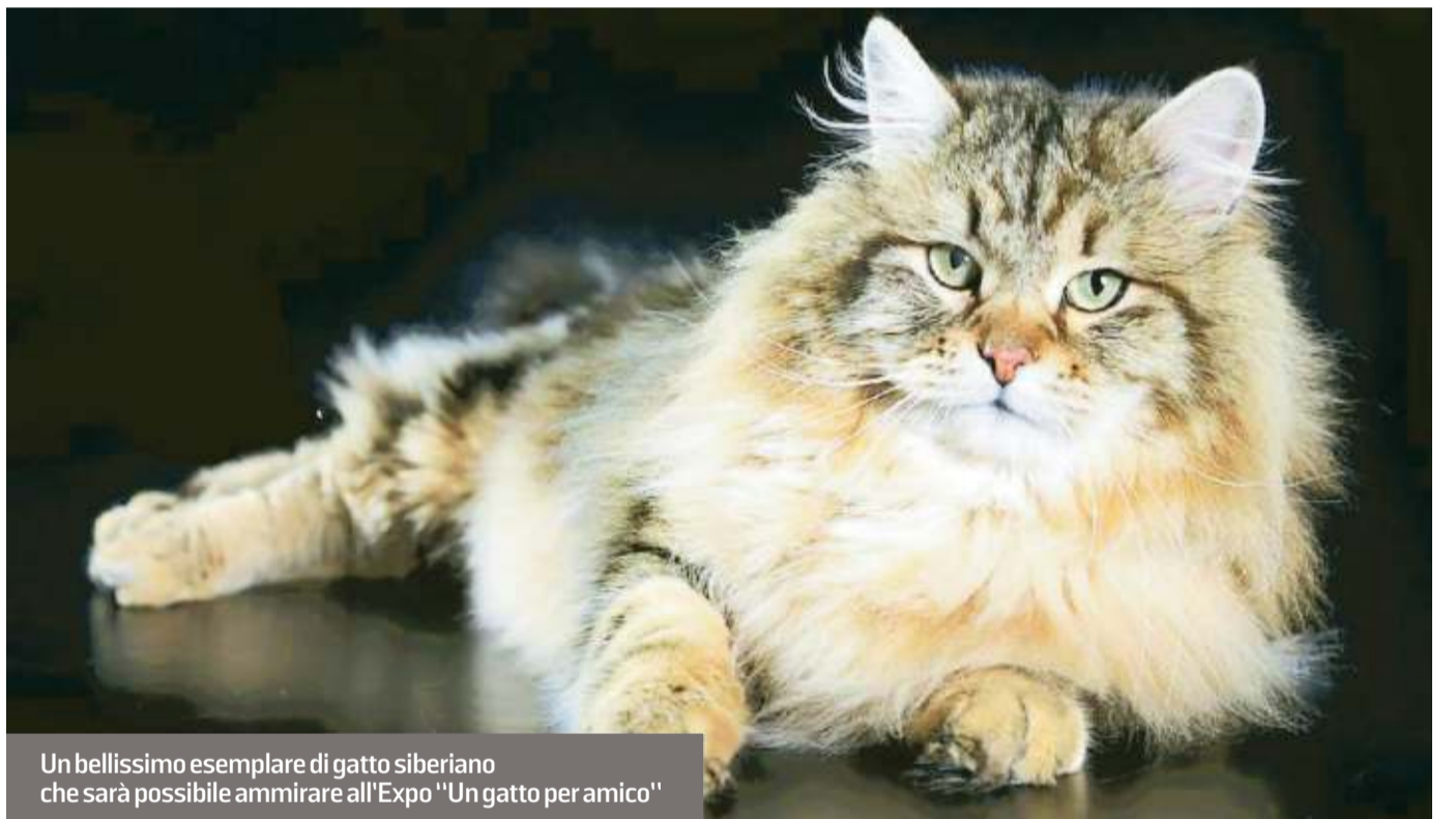
Un bellissimo esemplare di gatto siberiano che sarà possibile ammirare all'Expo "Un gatto per amico"

A "Un gatto per amico" è abbinato un concorso fotografico riservato a tutti i gatti i cui proprietari risiedono in Toscana. All'interno dell'Esposizione Felina sarà allestita una mostra fotografica realizzata con gli scatti dei cari beniamini a