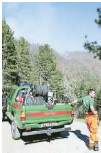
VOLONTARI IN ATTESA DI ENTRARE IN AZIONE DOMENICA SCORSA PER L'INCENDIO DI BOSCHI A PONTITO

La stima dei danni ambientali, seppur provvisoria, appare consistente. In due giorni sono bruciati, complice il clima secco e il vento, oltre 25 ettari di patrimonio boschivo, di cui 12 nella zona sopra San Quirico e Stiappa (a prevalenza castagni), il resto (in una zona più impervia) a