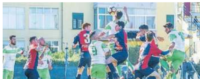
Un momento del match della Pro Livorno Sorgenti MASINI/PENTAFOTO