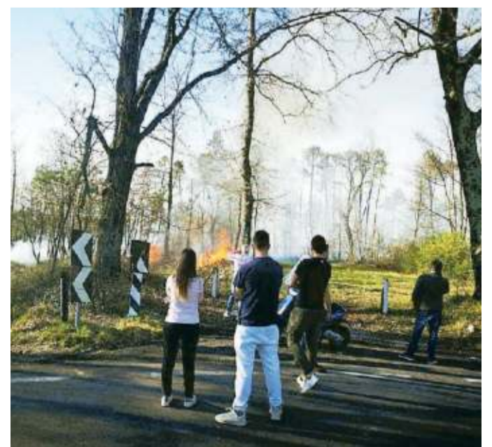
Alcuni residenti assistono all'incendio nel bosco delle Cerbaie