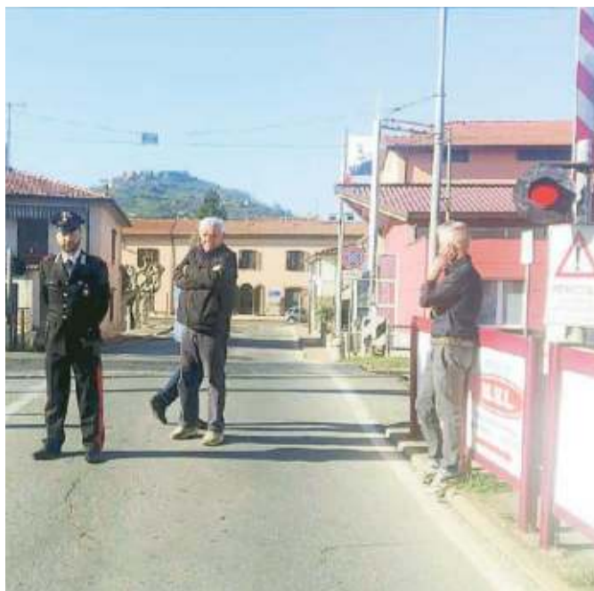
Un carabiniere al passaggio a livello per impedire l'attraversamento