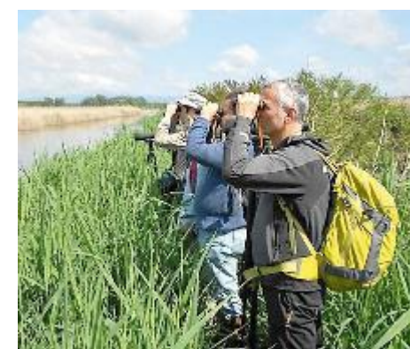
Il Padule di Fucecchio è considerata l'area umida interna più importante d'Europa

delle «Morette» meta abituale di scolaresche in visita al Padule, così come il comune di Larciano, ove ricade il centro visite di Castelmartini, anch'esso costruito con finanziamenti europei, potrà decidere di assegnare la struttura in gestione a chi riterrà opportuno; infine il comune di Altopascio deciderà a chi affidare la gestione del lago della Sibolla, altra area di pregio ambientale. E' un provvedimento illogico: tutti i servizi pubblici per una migliore qualità, efficienza ed economicità tendono a essere raggruppati».