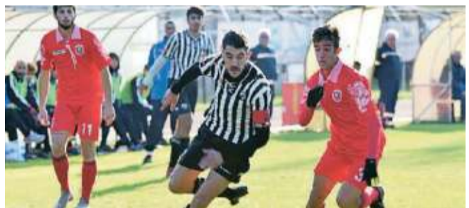
Sciapi, a segno su rigore