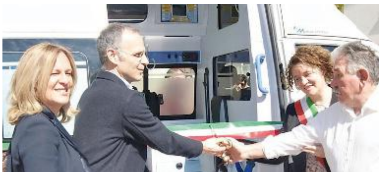
Un momento della cerimonia che si è tenuta al Soccorso Pubblico