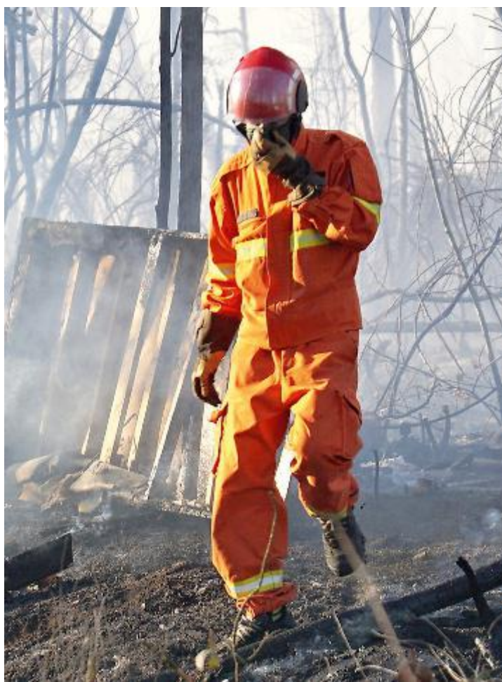
È stata un'altra giornata impegnativa per vigili del fuoco e volontari che hanno dovuto combattere a lungo contro le fiamme

A Monsummano la misura cautelare è stata applicata ad un operaio 45enne, pregiudicato, per avere in più occasioni malmenato la convivente 49enne, provocandole anche lesioni riferite al pronto soccorso di Pescia, dove è stato avviato il protocollo rosa. Le conseguenti attività di indagine attivate dal locale comando dell'Arma, hanno condotto all'emissione del provvedimento. In entrambi i casi le eventuali violazioni delle prescrizioni da parte degli indagati, porterebbero all'applicazione di una misura cautelare più grave come i domiciliari o il carcere.