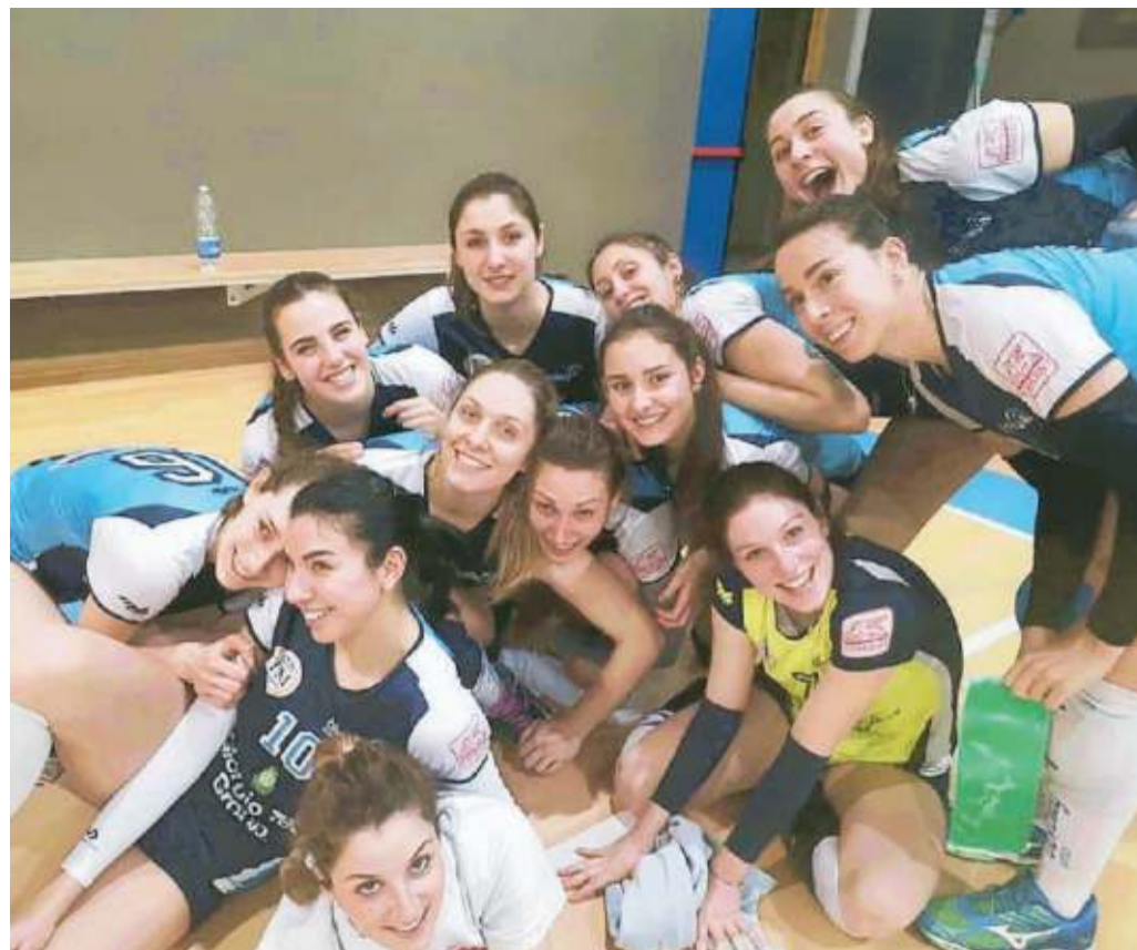
La gioia delle ragazze del Blu Volley Quarrata