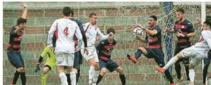
Un match del Montignoso