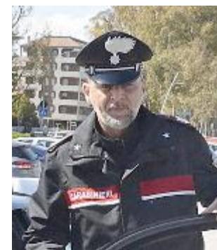
Dei due casi si erano occupati i militari

persone all'interno, e per i cavalli nelle stalle di un centro ippico, evacuato in via preventiva. Indagini in corso anche da parte dei carabinieri forestali sulle cause del rogo. L'ipotesi più probabile è che a innescarlo sia stato un residuo di abbruciamenti avvenuti nei giorni scorsi. Il vento lo avrebbe riacceso dando il la al fuoco che ha devastato quasi 50 ettari di bosco.