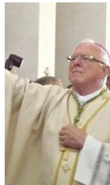
La benedizione della nuova chiesa del vescovo monsignor Roberto Filippini