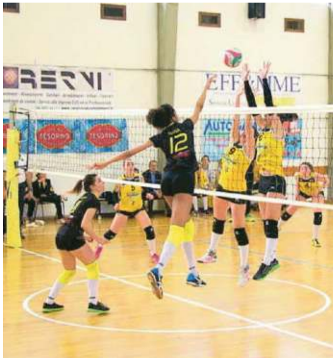
Un'azione delle ragazze della Timenet Empoli