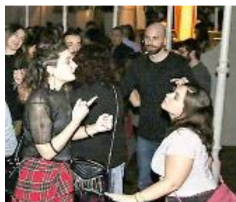
Ancora sballo in discoteca