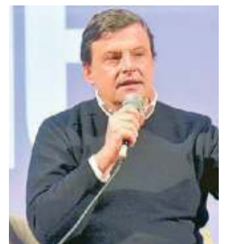
Carlo Calenda, ex ministro allo sviluppo economico del governo Gentiloni

PISTOIA. L'ex ministro allo sviluppo economico Carlo Calenda sarà a Pistoia Venerdì 15 marzo a partire dalle 21 al museo Marino Marini (Corso Silvano Fedi, 30 - Pistoia). L'iniziativa s'intitola: "Diamo una scossa all'Europa. Come?". Calenda sarà intervistato da studenti e giovani pistoiesi sui temi europei. Gli organizzatori invitano i cittadini a partecipare e far valere le proprie idee a sostegno di un'Europa diversa e migliore. —