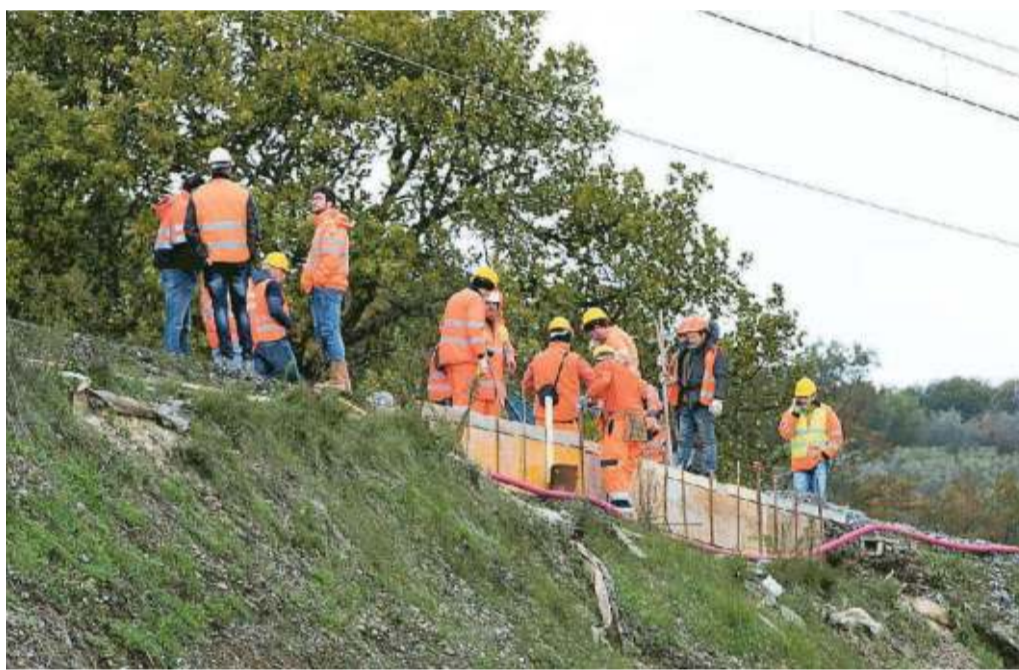
Operai e tecnici al lavoro per il raddoppio della ferrovia nella zona della Colonna

Della nuova viabilità per superare i binari raddoppiati però non c'è alcuna traccia. «Dovrebbero realizzare prima il viadotto nell'area ex Minnetti, dove c'è il campo base e le aziende hanno mano libera, in