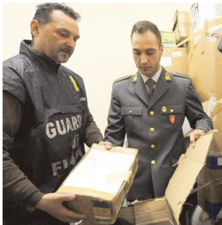
FIAMME GIALLE Le indagini sono state condotte dalla guardia di finanza

Una consistente parte della cifra è stata subito recuperata grazie all'iniziativa dell'azienda stessa. Adesso è rimasto in piedi il filone penale di un caso che, negli anni,