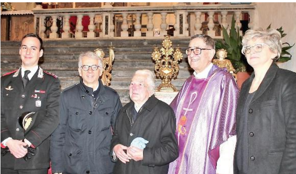
Le autorità nella chiesa della Santissima Annunziata di Pontremoli dove si è svolta la cerimonia

Riconosciuto sul web: la cerimonia della riconsegna a Pontremoli