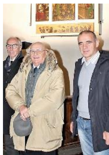
Molti i fedeli presenti in chiesa

«È CON immenso orgoglio e piacere che noi carabinieri partecipiamo alla cerimonia di oggi – ha detto – fieri di aver restituito alla splendida comunità di Pontremo-