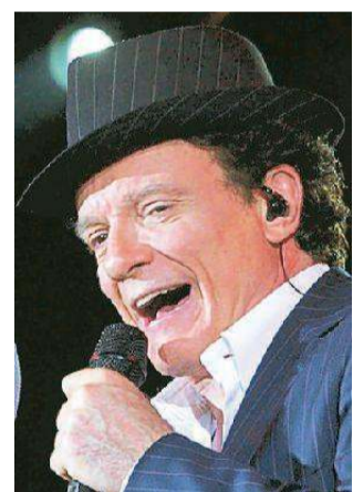
Massimo Ranieri salirà mercoledì sul palco del Politeama Pratese col suo Sogno e son desto-400 volte

Appuntamento dunque alle 21 al Teatro Politeama pratese in via Giuseppe Garibaldi 33. Per informazioni e a disposizione il numero 0574 603758. —