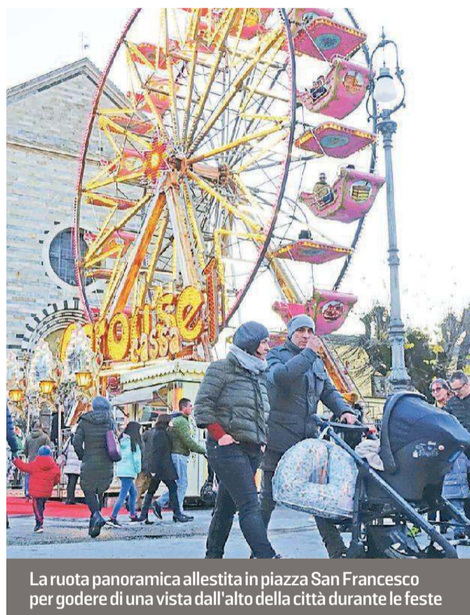
La ruota panoramica allestita in piazza San Francesco per godere di una vista dall'alto della città durante le feste

Piazza San Francesco resta invece il centro principale del Natale dei bambini. Qui sono stati allestiti e resteranno in funzione per questi tre giorni la pista di pattinaggio e la ruota panoramica in piazza San Francesco. Ed è da qui che parte e arri-