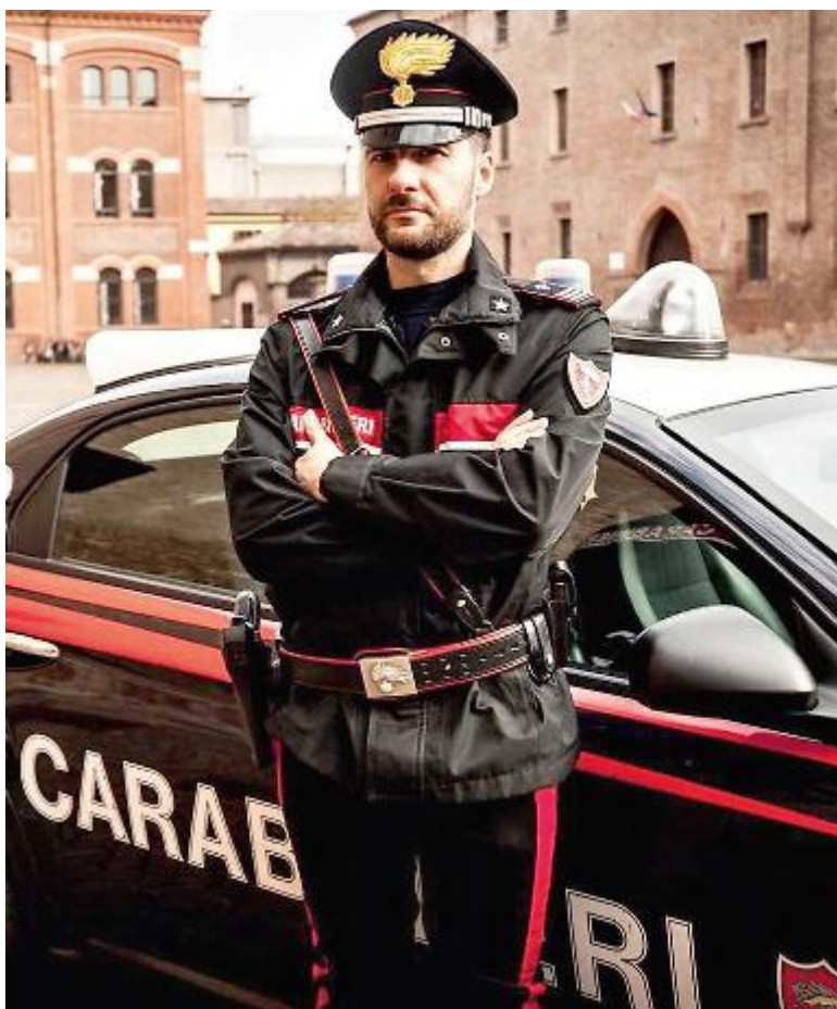
Truffa sventata dal dirigente della società e dai carabinieri di Forlì

re: «Dopo l'aver scoperto il tentativo di truffa, quello che mi preme ora è mettere in guardia le altre società della zona da simili situazioni. Questi personaggi avevano studiato tutto a puntino; potrebbero riprovarci altrove e penso sia meglio far sapere a tutti quello che può accadere. Fa davvero male che, a fronte di tanto impegno spesso volontaristico sul quale si basano tante società che s'impegnano per permettere a tanti ragazzi di praticare un qualsiasi sport, ci sia chi organizza simili raggiri per sfruttare la buona fede di tanti».