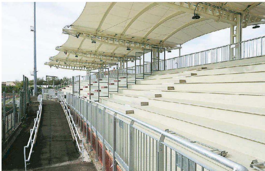
Gli spalti dello stadio Strulli di Monsummano, dove è avvenuta la rissa

L'aver perso i nervi in campo, forse gli avrebbe dovuto far capire che fosse meglio raggiungere gli spogliatoi. Il mister, invece, ha deciso di seguire la gara dagli spalti. Ma non si è accomodato tranquillamente in panchina. Il tecnico ha con-