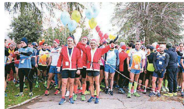
La partenza della corsa