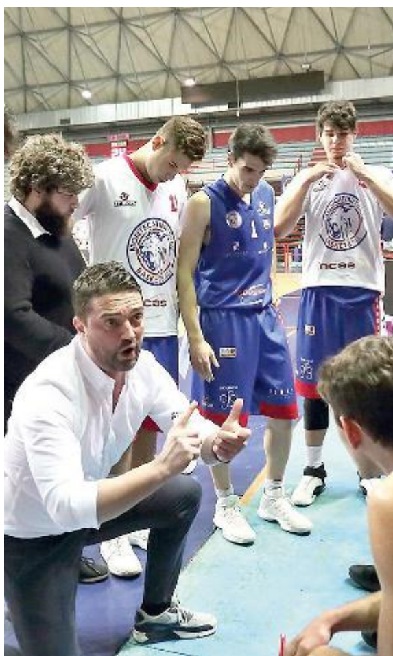
GIORNATA STORTA La squadra di Tonfoni torna dal Valdarno con un punteggio troppo punitivo