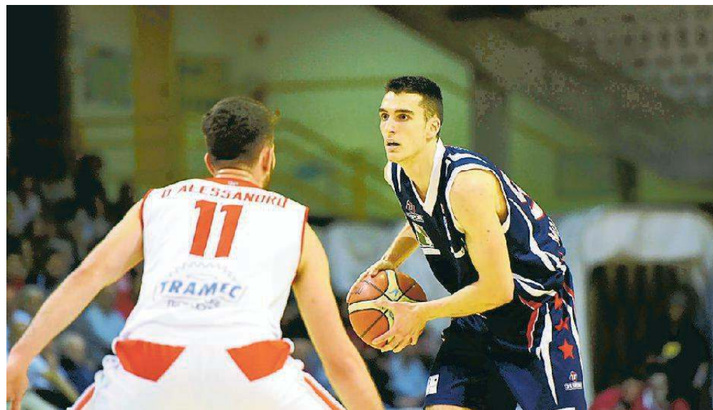
Bolis, un altro terminale dell'attacco di Montecatini

Nel primo tempo la gara è divertente e vibrante, le due squadre si affidano ai tanti possessi offensivi per creare difficoltà agli avversari ma