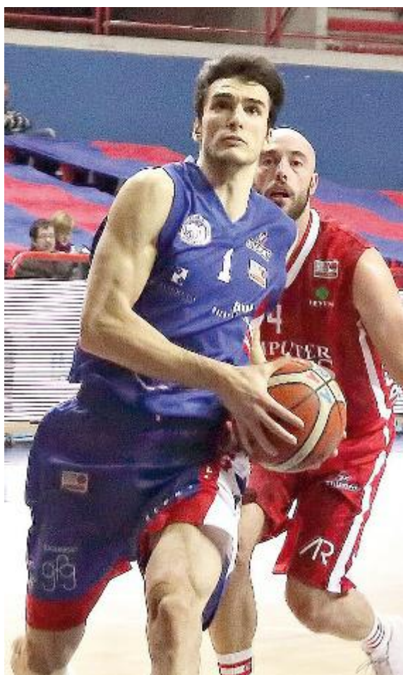
RITORNO AL SUCCESSO Per Bolis (8 punti) e soci la vittoria mancava dal 4 novembre