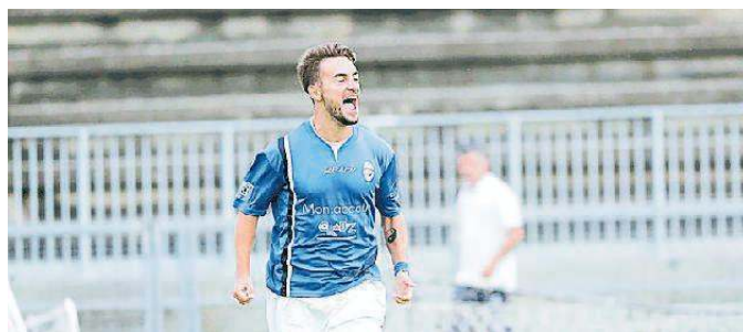
Citera: sua una delle tre reti del Montecatini