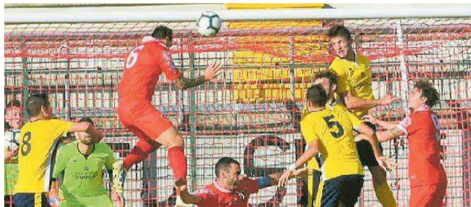
Un'azione offensiva del Castelfiorentino