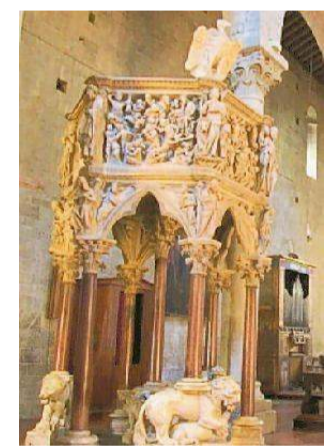
Alla scoperta del pulpito di Giovanni Pisano nella chiesa di S. Andrea e dell'oratorio con il Centro Guide

Durata della visita due ore circa - Costo: 8 euro a partecipante. Per informazioni e prenotazioni: 335 7116713 centroguide.pistoia@gmail.com. —