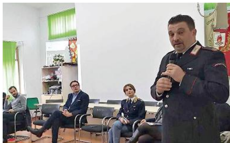
Un momento dell'incontro organizzato dall'amministrazione comunale in occasione della giornata contro la violenza sulle donne

Lezione particolare per i ragazzi della scuola «Levi»