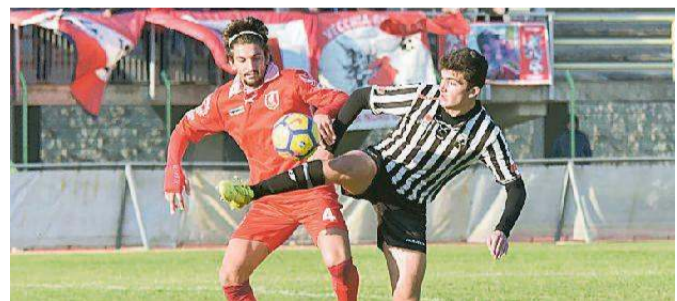
Un duello di gara