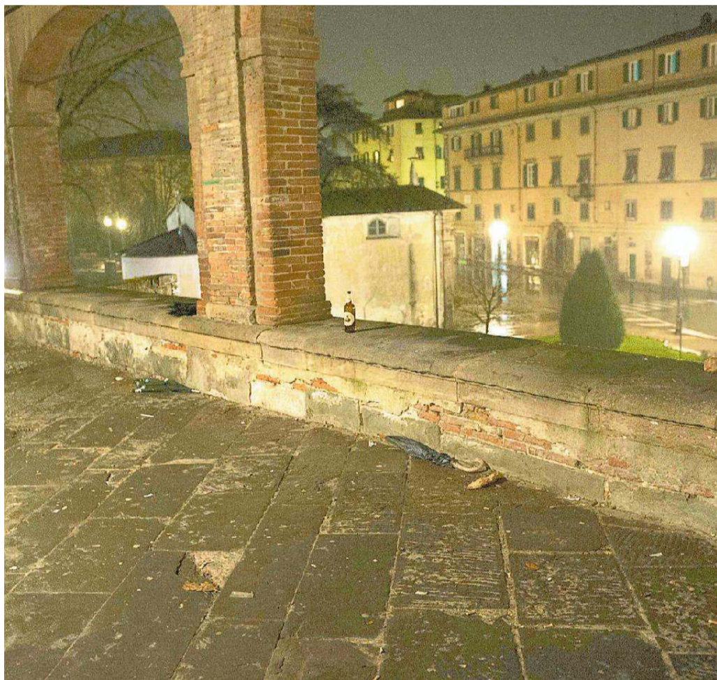
Le mura di Porta a San Pietro, a Lucca, dove è stato picchiato il 14enne valdinievolino

L'aggressione a Lucca sabato pomeriggio: il giovane preso a calci e pugni. Era con la fidanzatina che sarebbe stata "disturbata" dal gruppo di coetanei