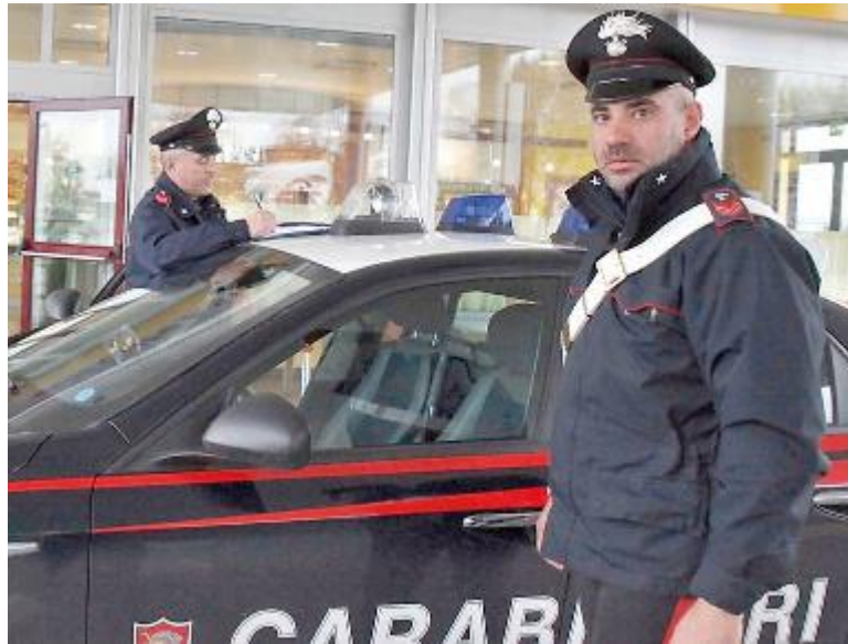
La denuncia della famiglia ai carabinieri sarà formalizzata oggi

A RACCONTARE l'accaduto è stata la madre, che nella serata di sabato, al suo ritorno a casa, l'ha