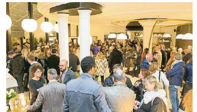
Il locale ha aperto nella dependance dell'hotel Biondi