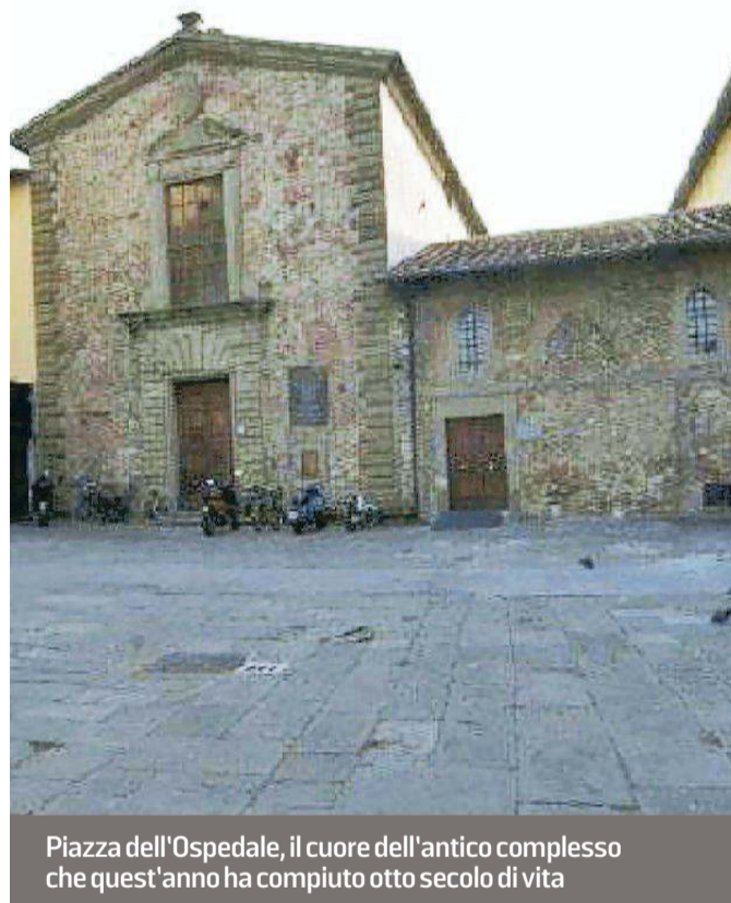
Piazza dell'Ospedale, il cuore dell'antico complesso che quest'anno ha compiuto otto secolo di vita

chivio “Diplomatico” di Firenze. Con questo documento, il pontefice Onorio III, incontrando le richieste del priore e dei frati ospedalieri, prese sotto la sua protezione e di San Pietro, il luogo dove era situato lo Spedale della Misericordia con tutti i beni posseduti. Ad avvalorare la data del 26 novembre 1218 concorre anche l'iscrizione latina su un cartiglio di stucco che si trova sulla porta orientale del Pellegrinaio Nuovo, dove si dice che nel 1218 i pratesi fondarono il nosocomio e l'orfanotrofio. L'autenticità del documento del XIII secolo è stata oggetto di riflessioni e valutazioni da parte di studiosi di vari perio-