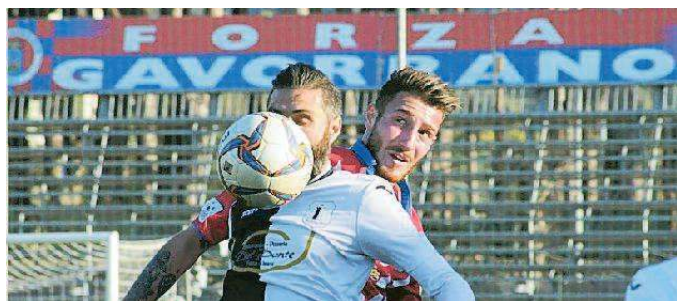
Zizzari, ancora un gol pesantissimo per la Zenith