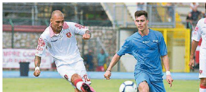
Per il Vorno un colpo importante