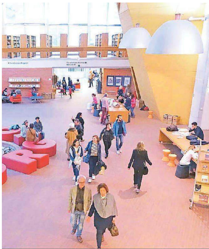
Una panoramica dell'atrio centrale della Biblioteca comunale San Giorgio: domani la Giornata della gentilezza

A Pistoia l'appuntamento principale è fissato per domani alla Biblioteca comunale San Giorgio. Il programma del pomeriggio prevede una serie di interventi sul tema della gentilezza.