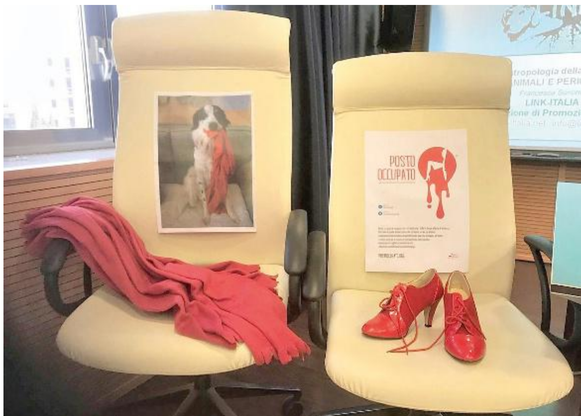
Le scarpe rosse occupano il posto che una donna uccisa avrebbe potuto prendere magari a un cinema, a un concerto, al teatro... La foto di Snoopy e la sua copertina rossa rappresentano tutti gli animali uccisi crudelmente per mano dell'uomo e che non occupano più un posto in famiglia, in strada, nel mondo