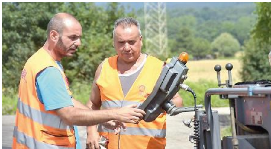
Nei giorni scorsi la Provincia ha dato il via al completamento dei lavori di riasfaltatura di via Roma in prossimità del semaforo

Marconi, potrebbero esserci disagi per l'erogazione idrica. Acque SpA infatti in questa prima fase, lunedì 12 novembre dalle ore 8.30 alle ore 12.30 sospenderà l'erogazione dell'acqua in località Via Nova per effettuare un collegamento provvisorio al fine di garantire la continuità dell'erogazione idrica e, una volta terminati i lavori di Autostrade, procederà alla realizzazione della nuova condotta definitiva. Un intervento, quello di Acque spa che, nel suo complesso, avrà un importo di circa 100 mila euro. Il ripristino del servizio potrà essere accompagnato da fenomeni di intorbidamento dell'acqua destinati comunque a scomparire in breve tempo. In caso di condizioni meteorologiche avverse l'intervento sarà rinviato al giorno successivo ovvero a martedì 13 novembre con le stesse modalità. Scusandosi per i possibili disagi, Acque SpA informa che per ogni ulteriore chiarimento o aggiornamento è possibile contattare il numero verde 800 983 389.