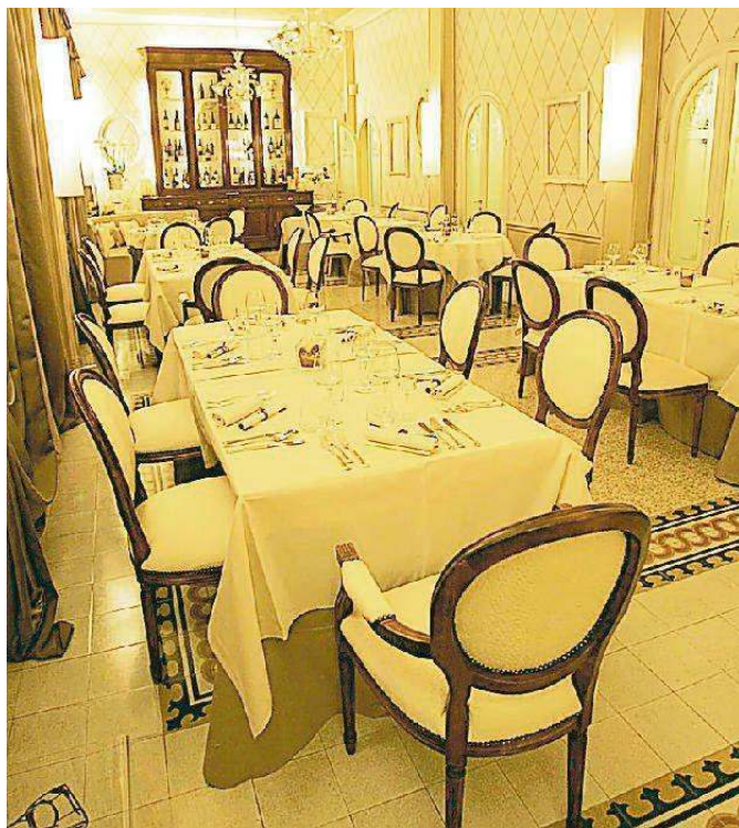
Il salone della Pecora Nera, hotel Ercolini & Savi

La nuova normativa pone grande attenzione ai temi della qualificazione delle aree urbane, sia di quelle soggette a degrado, anche a livello commerciale, che di quelle di pregio che richiedono interventi per mantenerne intatte le caratteristiche. «Misure come quelle per la valorizzazione dei piccoli centri o dei centri commerciali naturali o per la rigenerazione urbana – spiega Ciuoffo – vanno in questa direzione. È una legge che