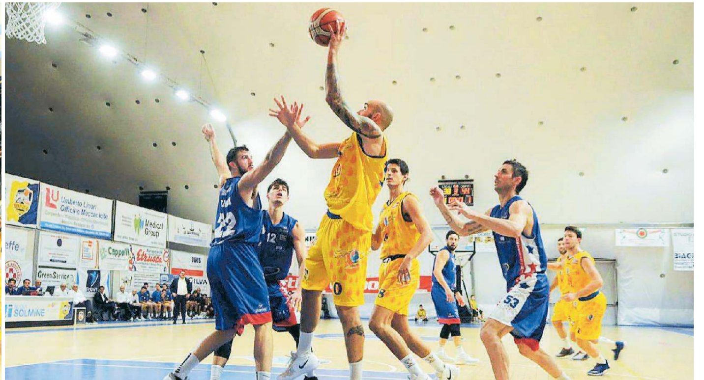
A sinistra stretta di mano tra i giocatori delle due squadre prima dell'inizio. Alla fine, come sappiamo, gli animi erano più tesi. Qui sopra un giocatore del Piombino contrastato da Giorgi e Migliori