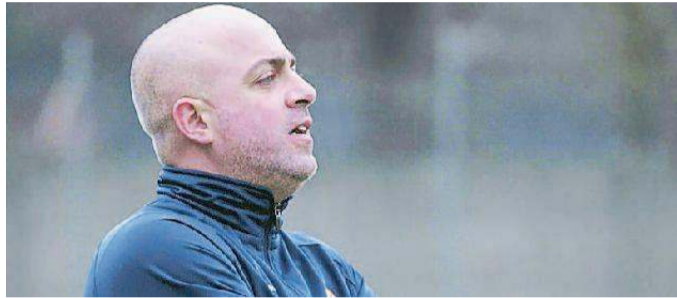
L'allenatore del Montignoso Gassani