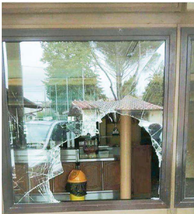
La vetrata rotta al bar del circolo di piazza Vittorio Emanuele

IL FURTO. Al circolo “L'Incontro” i malviventi hanno forse usato una spranga di ferro per rompere la vetrata della porta d'ingresso. E, a quel punto, hanno avuto via libera per entrare all'interno del locale, a pochi passi dalla chiesa Santa Maria della Neve e pure dall'abitazione di don Romano Gori , il sacerdote alla guida della parrocchia da quasi trent'anni, scomparso mercoledì scorso per una crisi cardiaca. Ieri mattina, quando i gestori del circolo sono arrivati, hanno subito notato un grosso buco nella vetrata principale e tante schegge al suolo. I ladri devono aver agito intorno alle 3, ma il bottino che