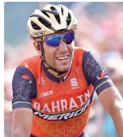
Vincenzo Nibali, campione siciliano ma nato ciclisticamente a Mastromarco