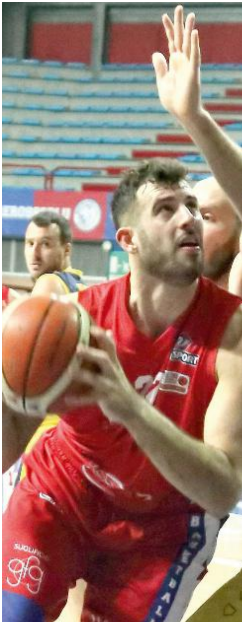
AL PALATERME Giovedì arriva Alba

PECCATO che il campionato incombe, giovedì si scende di nuovo in campo contro la Witt S. Bernardo Alba e di tempo per apportare correttivi ce n'è poco. Tonfoni però ha le idee chiare su quali siano gli aspetti da migliorare: «Per prima cosa dobbiamo cercare di eliminare il più possibile alcuni errori individuali su entrambi i lati del campo. Una volta andati sotto nel punteggio c'è stata poca collaborazione in fase difensiva e in attacco ci siamo un po' persi, sbagliando troppe conclusioni facili. Credo che sia dovuto all'incapacità di mantenere la concentrazione al massimo per tutta la durata della partita, dobbiamo imparare a rimanere attaccati al match anche quando le cose vanno male. Quello che possiamo fare nell'immediato è oliare i meccanismi difensivi, lavorare sui blocchi e sulla velocità con cui ci accoppiamo con i nostri avversari diretti».