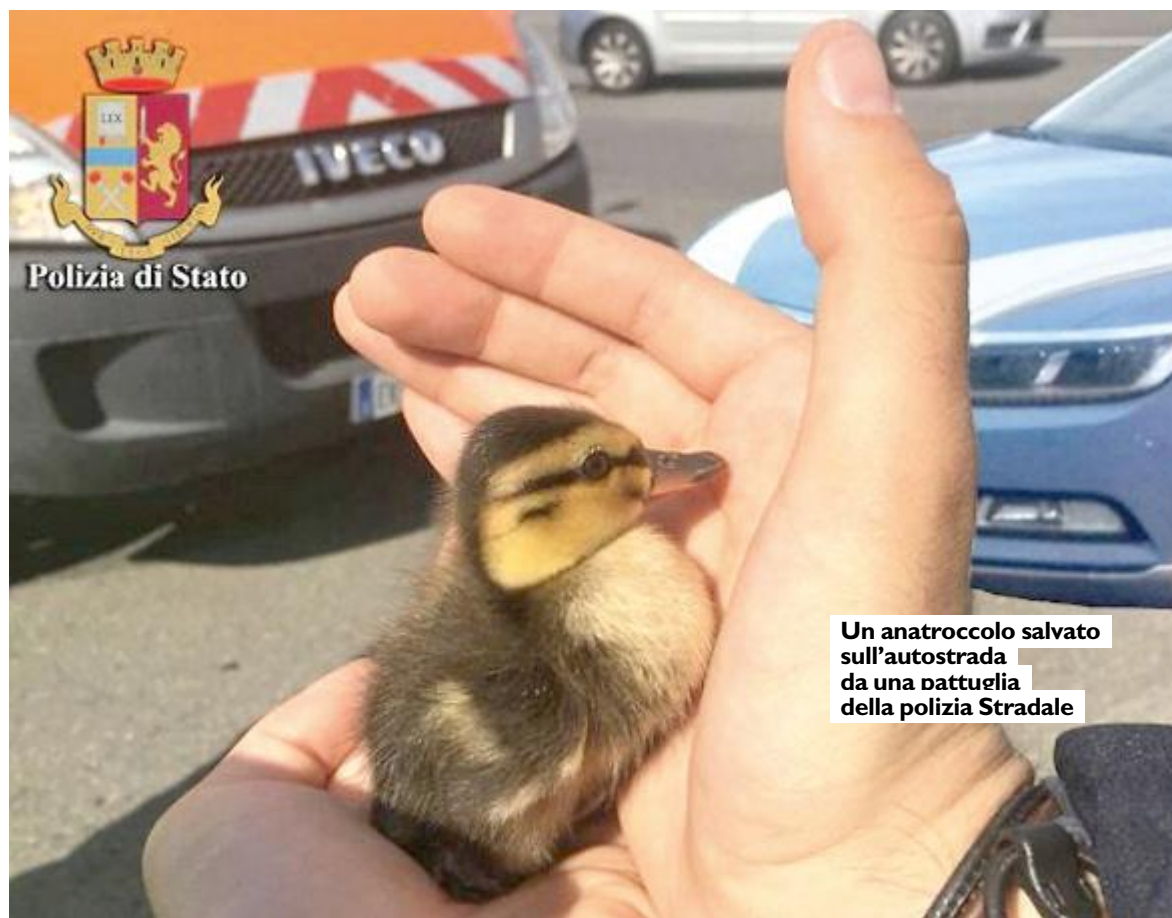
Un anatroccolo salvato sull'autostrada da una pattuglia della polizia Stradale

NON SI CONTANO poi i numerosi casi di salvataggio di cani e gatti "vaganti" sulle strade. E c'è anche il caso particolare del salvataggio di un pappagallino colorato che era entrato nell'Autogrill Arno Est, sull'A/1: è intervenuta la Stradale di Arezzo. Impossibile raccontare tutti i casi nei quali la polizia Stradale è risultata preziosa per salvare piccole vite. Noi con questi esempi abbiamo voluto ringraziare i poliziotti per il grandissimo lavoro che ogni giorno - con enorme impegno e sensibilità - fanno nei confronti non solo degli umani ma anche degli animali.