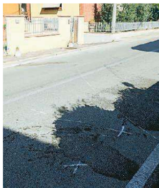
Il luogo dell'incidente