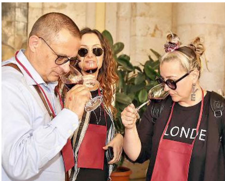
La degustazione al Tettuccio con oltre mille etichette è stata come sempre il momento clou della rassegna «Food & Book»

BILANCIO positivo intanto del festival «Food & Book» che ha visto anche la partecipazione del ministro dell'agricoltura Gian Marco Centinaio. Come sempre uno dei momenti clou è stata la degustazione dei vini con mille etichette