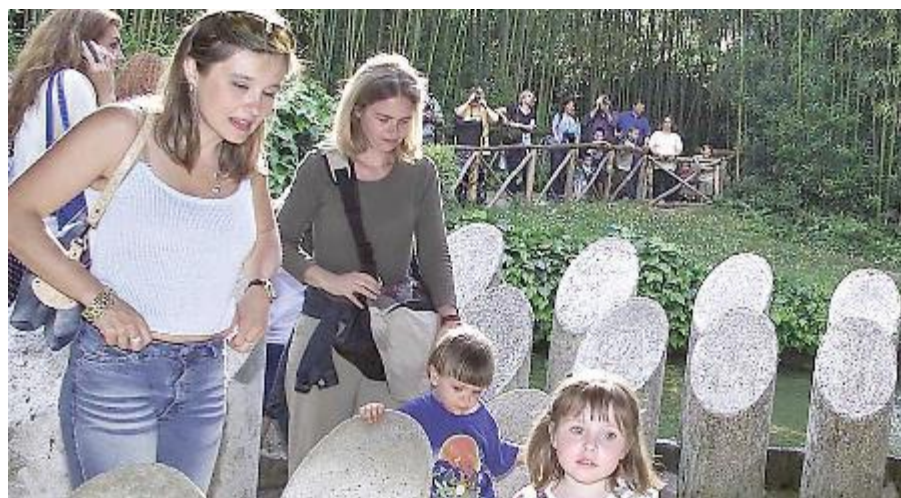
Turisti al parco di Pinocchio. Di recente il commissario prefettizio ha iniziato e concluso la procedura per la realizzazione del Paese dei Balocchi