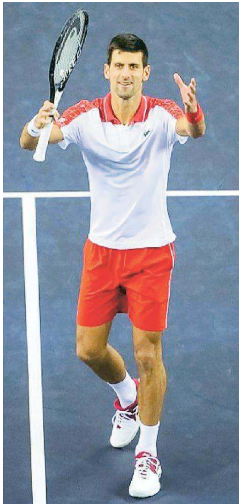
A sinistra Novak Djokovic, a destra Camila Giorgi

Camila Giorgi ha vinto il torneo Wta di Linz, in Austria. La 26enne di Macerata, numero 32 del ranking mondiale, ha sconfitto in due set (6-3, 6-1) in meno di un'ora di gioco, la russa Ekaterina Alexandrova, proveniente dalle qualificazioni. Grazie a questo successo, Camila Giorgi salirà oggi al numero 28 del ranking mondiale Wta, sua miglior posizione di sempre.