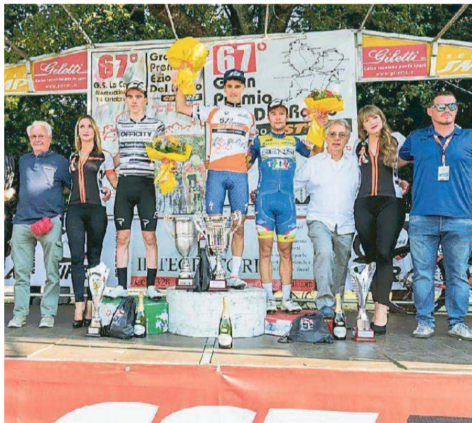
Il podio del 67° Gran premio Ezio Del Rosso

Un successo maturato dopo un serrato sprint col friulano Aleotti e davanti agli altri tre compagni di fuga Corradini, De Bod e Tortomasi. Garavaglia, pur non vincendo molto, quest'anno aveva già trionfato sul traguardo di un'altra illustre Classica del ciclismo dilettantistico toscano come la 74ª Coppa Giulio Burci a Poggio a Caiano. Sono stati 106 i partenti e soltanto 23 i concorrenti classificatisi all'arrivo. La giornata di sole ha subito favorito le prime scaramucce, con gruppetti di atleti che si sono alternati al comando in varie fasi della corsa e sulla salita del Vico. Si è comunque iniziato a fare veramente sul serio soltanto all'inizio della lunga scalata verso il Gpm del Goraiolo, quando al comando sono rimasti 18 concorrenti. Il caldo e le pendenze hanno favorito la selezione decisiva e così sul GPM