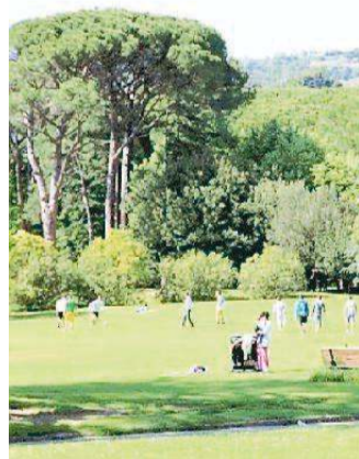
Il parco termale di Montecatini

Come già annunciato si tratta di alberature così suddivise: 23 nuovi tigli, 4 aceri, 2 frassi-