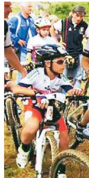
La partenza di una delle gare

Sabato prossimo terzo atto di questa rassegna riservata ai giovanissimi dai 7 ai 12 anni. Queste invece le classifi-