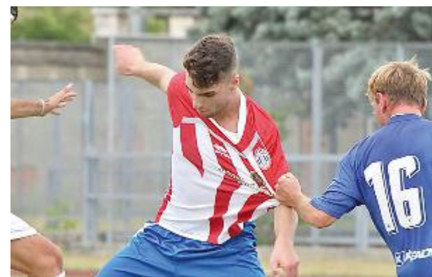
CLASSIFICA Biancorossi a 4 punti dopo 4 giornate

Eccellenza La partita giocata a Venturina