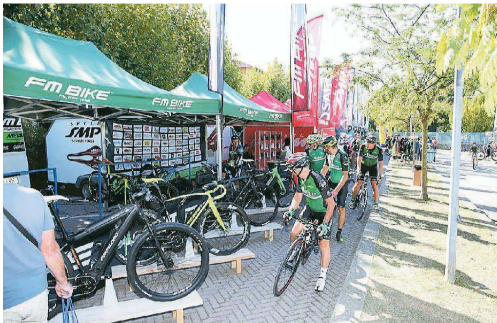
Alcune delle biciclette in esposizione nel parcheggio di viale Fedeli

La zona logistica è stata allestita all'intero dell'hotel Belvedere, mentre le oltre seicento biciclette, appartenenti ai marchi più noti e allettanti, sono state esposte nel parcheggio antistante, di viale Fedeli. L'inaugurazione ufficiale dello Shimano Steps Italian Bike Test Village è avvenuta sabato con la presenza delle autorità cittadine, del campione del mondo 2008 Alessandro Ballan , degli organizzatori e di Massimo Anzilotti del team Mtb Montecatini, che ha curato l'allestimento dei quattro percorsi su cui provare le Mtb, le e-mtb, le bici da strada, l'e-road bike, le gravel adatte alle strade bianche