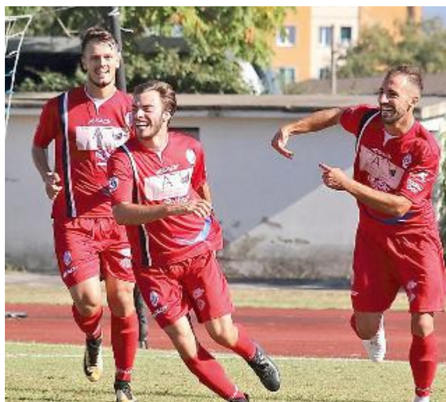
FESTA L'esultanza dei termali dopo un gol

CON un gol per tempo il Valdinievole Montecatini liquida l' Atletico Cenaia dopo una partita ricca di occasioni. Entrambe le squa-