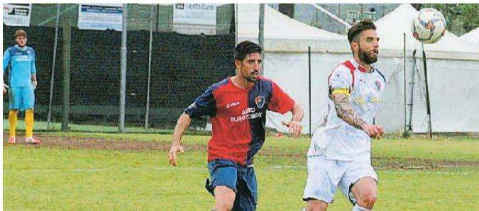
Zizzari, a segno su rigore a Borgo San Lorenzo