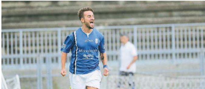
Citera (Montecatini): per lui standing ovation