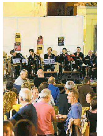
Musica in piazza venerdì sera a Ponte Buggianese con l'orchestra OsmannGold

co ridotto rispetto alla big band classica, gli arrangiamenti, il sound ricercato e la scelta del repertorio sono volti a recuperare quel rapporto tra musica e spettacolo proprio delle grandi orchestre jazz di quegli anni. In caso di maltempo il concerto verrà eseguito presso la Sala della Musica della Banda in Via della Libertà 89. —