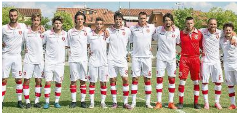
COMUNQUE ENCOMIABILE Il Ponte Buggianese 2018-19

seto, la cui voglia di far bene del Grosseto è così tanta, che i biancorossi maremmani si portano in vantaggio quasi subito: dopo neanche 2' l'arbitro decreta una punizione dal limite dell'area di rigore del Ponte, che Pierangiolo calcia magistralmente di destro,