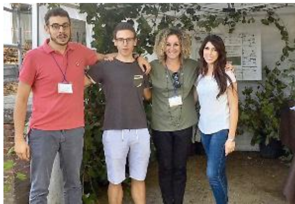
Lo stand dell'«Anzilotti» alla manifestazione di Lucca

raggio è servito a raccogliere i dati relativi all'incidenza di peronospora e oidio; lo spin-off Horta dell'Università Cattolica ha fornito dei modelli epidemiologici previsionali e i trattamenti contro le malattie sono stati eseguiti, su una porzione sperimentale di vigneto, in base alle allerte di infezione.