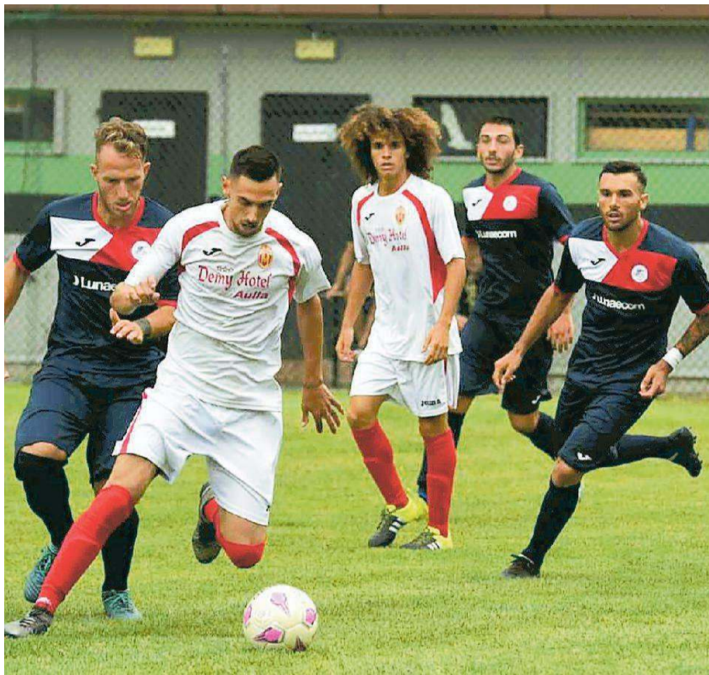
Un'azione del Montignoso (in maglia bianca) in una recente amichevole

Il Montignoso imbastisce un 4-3-3 che predilige i lanci lunghi sugli esterni Tonazzini e Nigiotti a scavalcare il centrampio, mentre la squadra di mister Niccolai ha tutt'altra im-