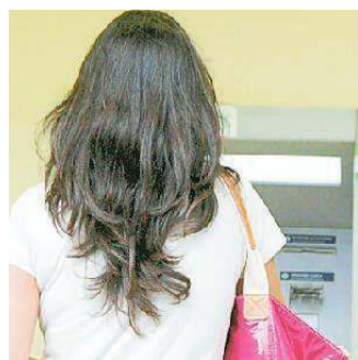
Prelievo al bancomat

«Aiutami per favore, sono rimasto senza benzina e devo tornare a casa». La richiesta, proveniente da un uomo sulla quarantina, alto e magro, italiano, è arrivata a un ragazzo che stava effettuando un prelievo di denaro sabato pomeriggio da uno sportello bancomat del centro di Montecatini. «Mia moglie mi