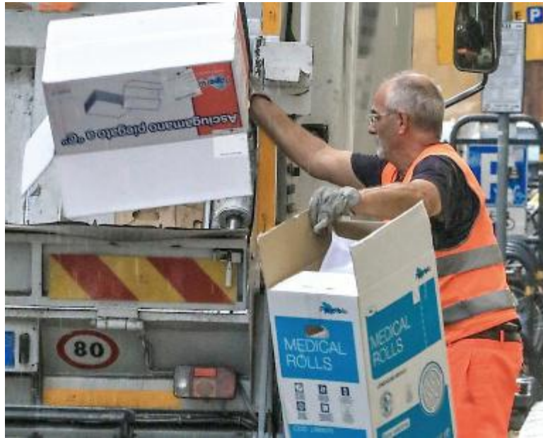
Il Comune di Montecatini esprime duri giudizi sul servizio finora effettuato da Alia. «Riscontrate diverse criticità da correggere subito»

«LA FERMA volontà – prosegue il Comune – è quindi quella di sollecitare Ato e Alia a una maggiore rapidità nella risoluzione di problemi emersi dall'avvio del servizio del nuovo gestore. In particolare si segnala una non sempre adeguata comunicazione all'utenza in merito alla raccolta e al ritiro di alcuni tipi di rifiuti e di ingombranti, errori frequenti, spostamenti di cassonetti, disguidi e comunicazioni inefficaci tra utenti e operatori del call center. Si invitano in questo senso i cittadini a segnalare disservizi in primo luogo direttamente ai numeri forniti dal gestore Alia e anche all'ufficio