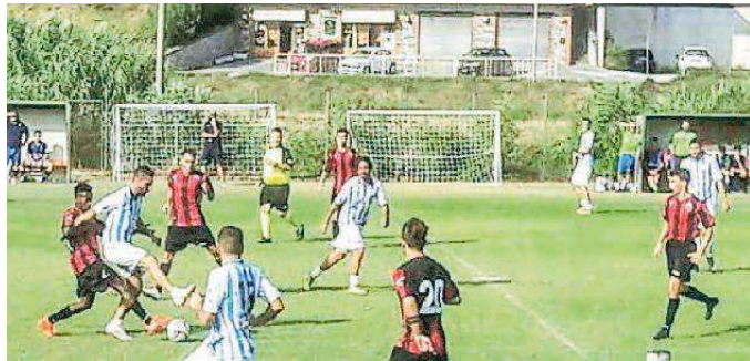
Una fase dell'amichevole tra Montecatini e la Berretti Lucchese