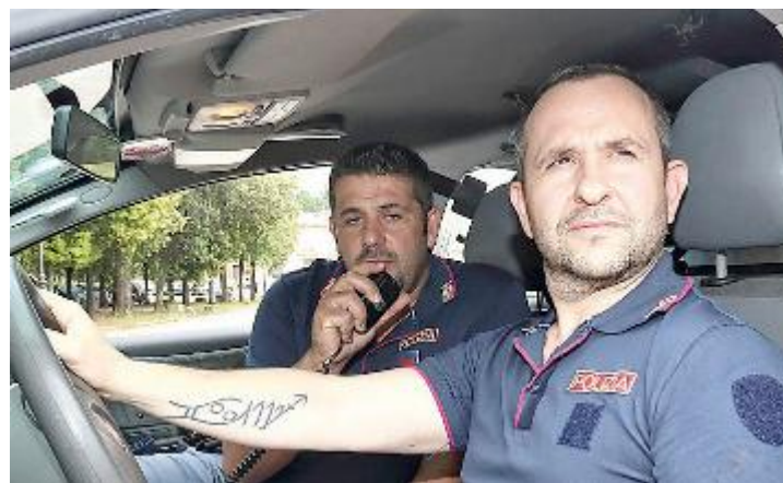
La polizia è intervenuta l'altra sera in via Marruota dopo la segnalazione fatta da un membro del Controllo di vicinato

CI SAREBBE anche uno dei giovani denunciati nei mesi scorsi dalla polizia per lesioni personali, minacce gravi e atti persecutori in concorso nei confronti di una transessuale, tra i ragazzi identificati all'alba di sabato in via Marruota. Le volanti del commissariato di Montecatini, diretto dal vicequestore Mara Ferasin, sono intervenute sul posto in seguito alla segnalazione fatta al 113 da un esponente del Controllo di vicinato, a causa delle bottiglie di birra lanciate contro le auto in sosta e le abitazioni. Lo scorso aprile, il giovane in questione, insieme ad altri tre ragazzi, uno dei quali minorenni, è stato denunciato in seguito alle indagini effettuate dalla squadra di polizia giudiziaria.