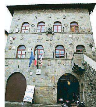
Il municipio di Pescia

I fotografi, dilettanti o professionisti, che vogliono partecipare con le loro fotografie dei siti "liberati" (cioè con delibera di giunta fatta per i diritti dell'immagine del proprietario, in questo caso il comune) possono inviare una email a turismo@comune.pescia.pt.it e pesciailtuopaese@gmail.com, oppure contattate direttamente l'ufficio del turismo al 0572 492257 – 490919 o Iuri Mazzamuto 345 8568727 di pesciailtuopaese.com sito web partner per i territori di Pescia e Uzzano.