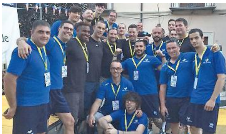
SQUADRA La Nazionale azzurra di Sitting Volley che ha preso parte alla Nerellum Cup giocando due partite amichevoli con Stati Uniti e Rotonda

«E' STATA UNA BELLISSIMA ESPERIENZA SOTTO OGNI ASPETTO QUESTA DISCIPLINA IN ITALIA E' ANCORA IN FASE EMBRIONALE MA IL METODO DI LAVORO E' GIA' DI ALTO LIVELLO»