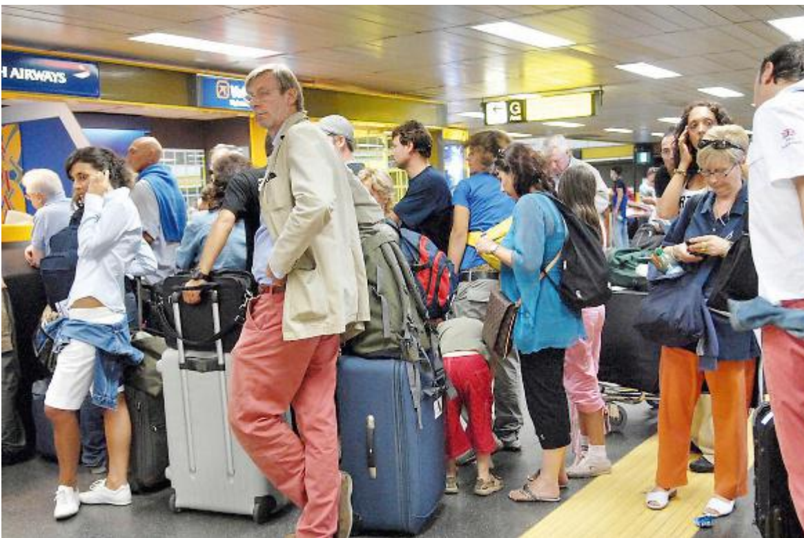
I turisti pesciatini avrebbero dovuto rientrare sabato ma il viaggio aereo è saltato