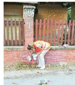
Un "angelo" all lavoro

E dopo il danno, non resta che ricostruire. Come alle Tamerici, dove gli Angeli del Bello di Montecatini si