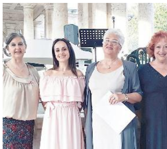
Un momento dell'iniziativa «Gardenia maestosa» realizzata allo stabilimento del Tettuccio