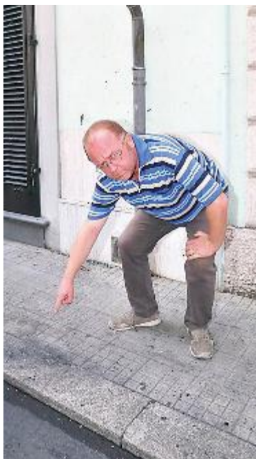
Di recente in via Garibaldi è stata bruciata un'auto