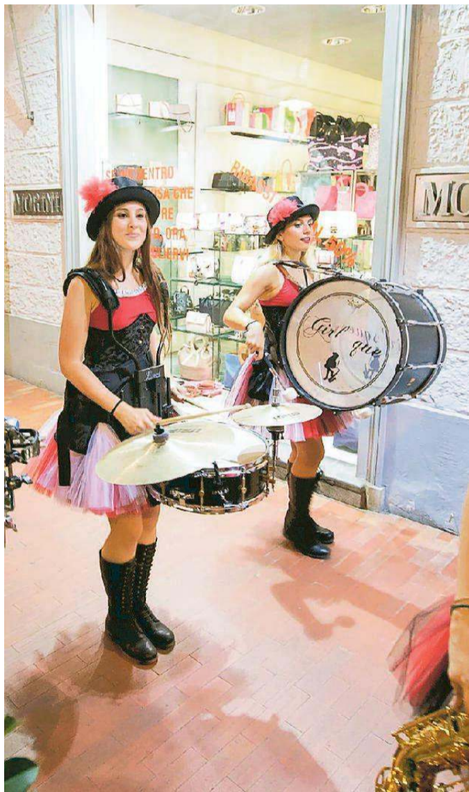
Street band per le strade del centro agli inizi di luglio

«E si tratterà - dice Chimenti - di un taglio di circa il 50 per cento rispetto al contributo dello scorso anno». Ma tant'è e basta piangere sul latte versato. Meglio cercare di