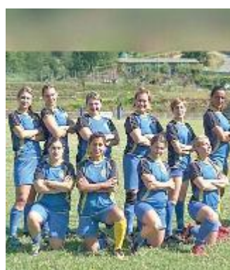
SQUADRA ROSA La formazione delle Corsare

LA SOCIETÀ sportiva Valdinievole Rugby Uzzano 2008 si prepara ad affrontare gli impegni della prossima stagione agonistica allargando la propria famiglia con nuove figure disponibili a potenziare le risorse tecniche e sportive e soprattutto a contribuire allo sviluppo di un progetto ambizioso come quello della scuola internazionale Carwin James dove è previ-