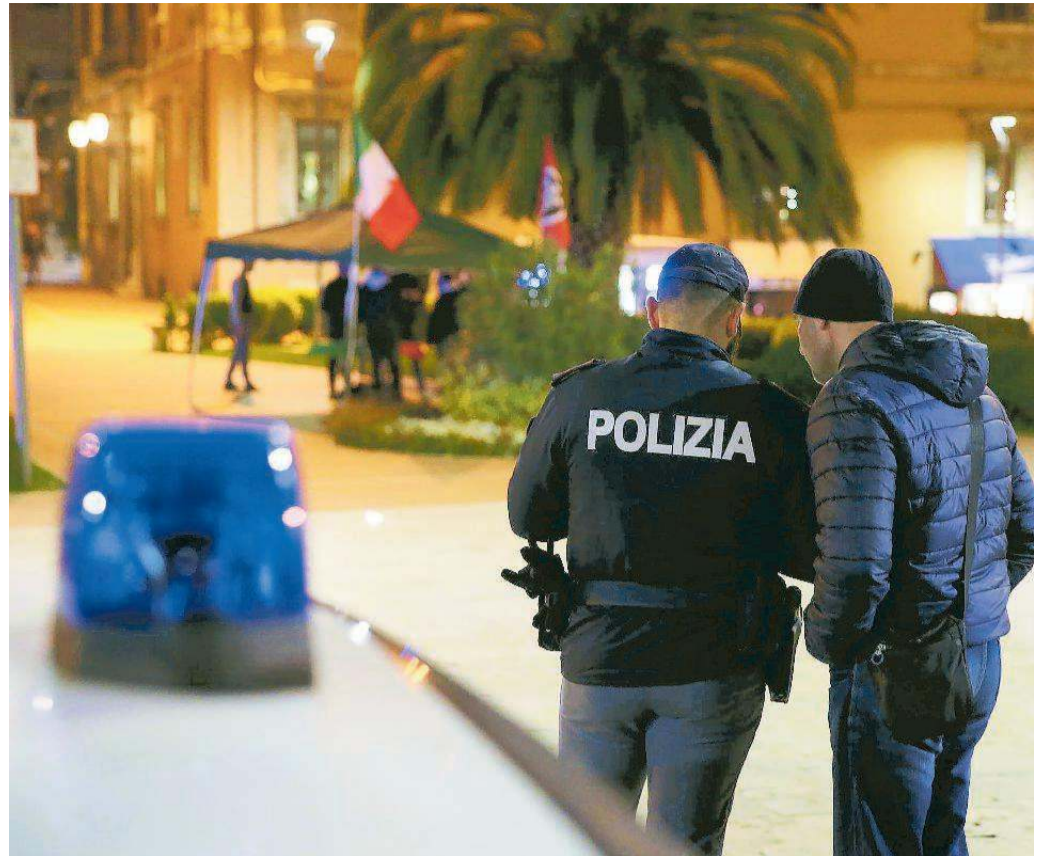
Controlli della Polizia in piazza del Popolo a Montecatini