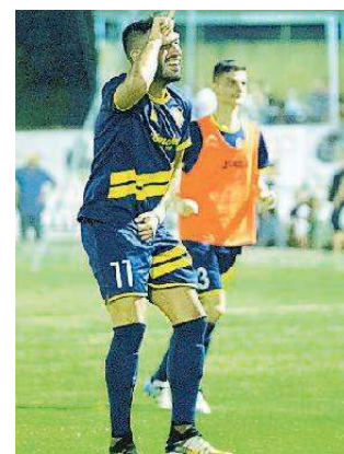
L'esultanza del Mastromarco

Questo l'inappellabile verdetto maturato nelle due semifinali disputate ai Giardinetti nella settimana da po-