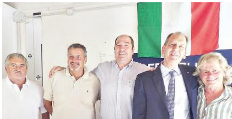
Alla cerimonia inaugurale anche l'onorevole La Pietra (secondo a destra)

INAUGURATA la sezione di Fratelli d'Italia a Buggiano, in piazza Coluccio Salutati, 24. A dare l'annuncio nel corso di una conferenza stampa alla sede borghigiana, accolti da Giacomo Grifò, che si occuperà della sezione come segretario comunale: il senatore e coordinatore provinciale Patrizio La Pietra, Lucio Avanzo della direzione nazionale e Simeone Clamori dell'assem-