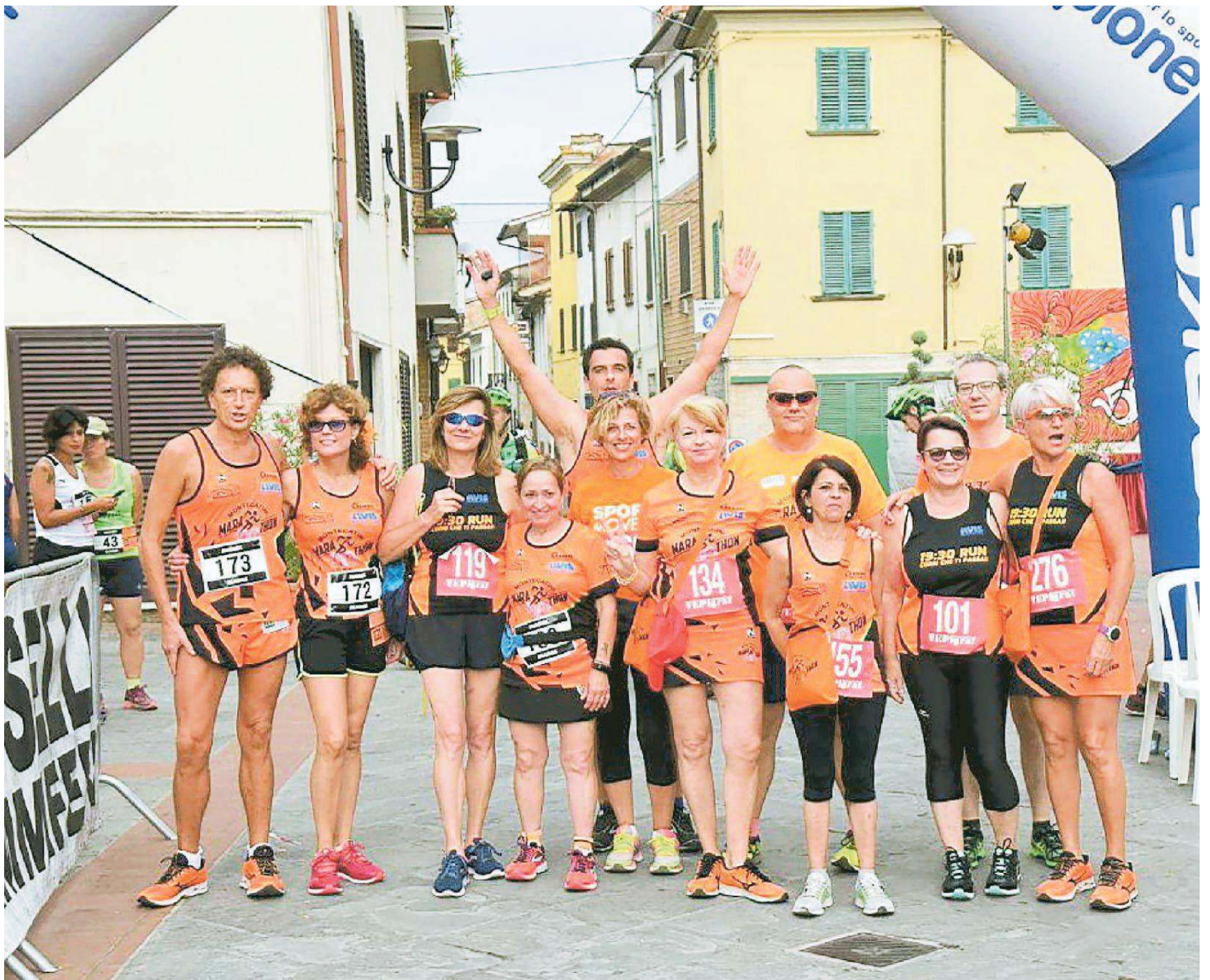
Un gruppo di atleti in posa per la Strachiesina