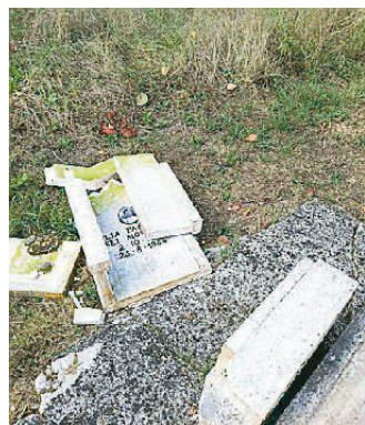
Uno dei cippi danneggiati

«I danneggiamenti ai cippi dei martiri dell'Eccidio del Padule di Fucecchio sono un grave oltraggio alla memoria delle vittime della barbarie