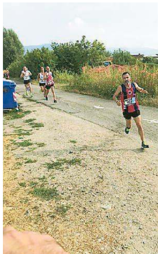
In corsa lungo il fiume