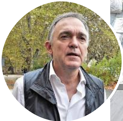
Il presidente della Regione Enrico Rossi e l'inaugurazione del monumento all'Eccidio alla presenza dell'allora Capo di Stato Carlo Azeglio Ciampi