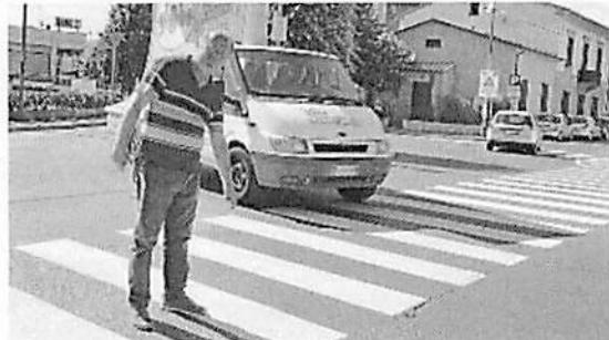
Le strisce pedonali realizzate il 18 luglio dentro la rotondina di via del Salsero. Ora sono state ricoperte di nero e cancellate

LO SCORSO 18 luglio operai incaricati dal Comune avevano realizzato nuove strisce bianche di segnaletica orizzontale lungo la circoscrizione sud. In prossimità della rotonda di via del Salsero erano state dipinte anche le strisce pedonali. Ma non prima dell'innesto nella rotondina, bensì al suo interno. Quindi l'automobilista avrebbe dovuto non solo verificare l'arrivo di un veicolo con precedenza sulla sinistra, ma anche la presenza di pedoni in fase di attraversamento. Stessa cosa per chi esce dalla rotondina: viene a trovarsi l'eventuale pedone sulla