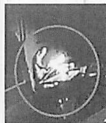
Il piromane accende il rogo

Sul fatto che lo abbia fatto volontariamente non vi è alcun dubbio. Nelle immagini della videosorveglianza si vede un uomo vestito di scuro che accende quello che sembra un drappo, probabilmente imbevuto di liquido infiammabile. L'uomo lo getta sull'auto e scappa, mentre in pochi secondi le fiamme avvolgono e divo-