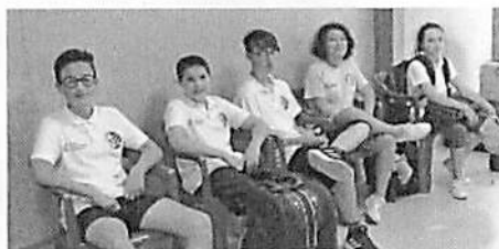
FUCINA DI TALENTI Giovani tiratori del Tsn Pescaia