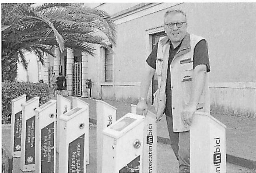
Lo stallo del bike sharing in piazza Gramsci: nessuna bici da mesi e mesi. E non è certo il solo