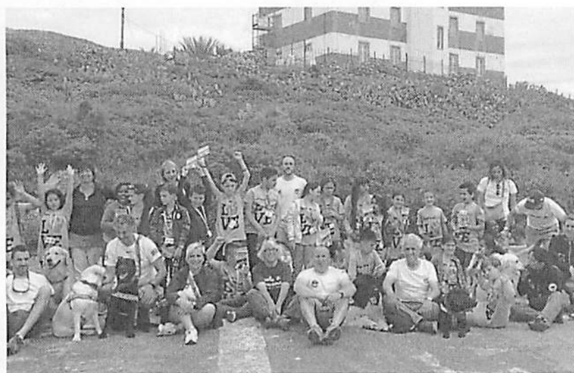
Foto di gruppo al faro di Capel Rosso all'isola del Giglio