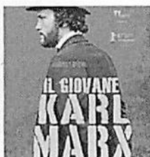
Stasera "Il giovane Karl Marx" all'arena di Villa Baldi Papini

ARENA - ESTATECINEMA Villa Bottini, via Elsa, 9 tel. 0583 445721.