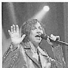
Gianna Nannini, il 16 a Pistoia