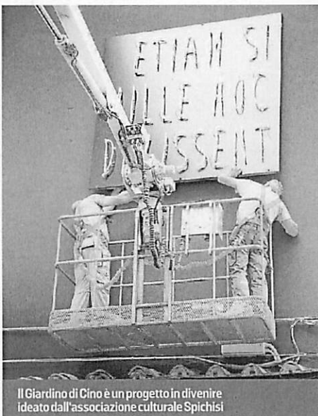
Il Giardino di Ciro è un progetto in divenire ideato dall'associazione culturale Spichisi

Nella sua prima serata, realizzata in collaborazione con l'Associazione Teatrale Pistoiese nell'ambito delle attività collaterali del Pistoia Blues 2018, il Giardino farà da quinta architettonica al concerto