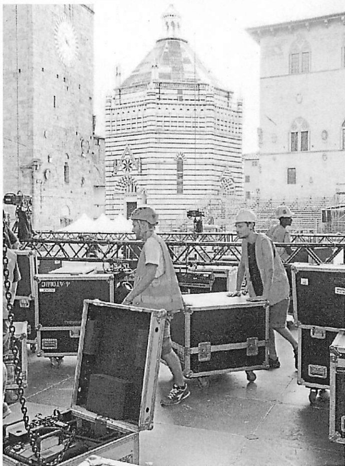
Si prepara il palco in piazza Duomo per il concerto di stasera di Alanis Morissette

Nel contesto del Pistoia Festival si terranno altri due concerti: Francesca Michielin (giovedì 12) e Gianna Nannini (lunedì 16).