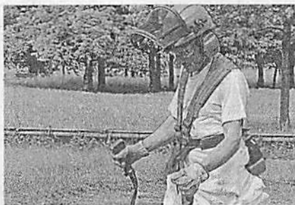
Is Ieri è iniziato il taglio delle erbacce a Veneri

Veneri per la scadenza del Carnevale, ma entro poco tempo completeremo questa operazione necessaria, sia per il decoro che per la sicurezza dei cittadini. Ho più volte detto che Pescia deve tornare a essere la Città dei Fiori e non delle erbacce, e così faremo».