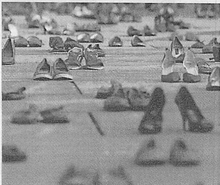
Le scarpe rosse, simbolo della lotta al femminicidio, saranno "protagoniste" in piazza del Popolo