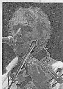
John Cale sarà il protagonista venerdì del primo appuntamento di Estate in Fortezza 2018

brillante carriera solista, alternando album rock a collaborazioni e musiche da film; ancora oggi porta avanti le sue infinite passioni destreggiandosi tra produzioni musicali, sperimentazioni e avanguardia sonora e visiva. Il biglietto alla cassa costa 30 euro, in prevendita (circuiti Ticketone e Boxoffice Toscana) 25 euro più diritti. —