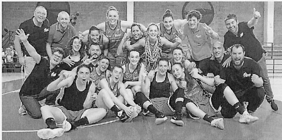
I protagonisti della storica impresa dell'Orza Rent Nico Basket Massa e Cozzile