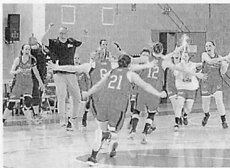
L'esultanza al suono della sirena

ne sarà lei la top scorer con 25 punti segnati.