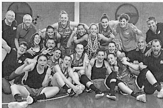
CAVALCATA VINCENTE La gioia della atlete valdinievole

MOMENTI DI GLORIA PER LA PALLACANESTRO DELLA VALDINIEVOLE CHE TORNA AI MASSIMI LIVELLI GRAZIE ALLE RAGAZZE DELLA NICO