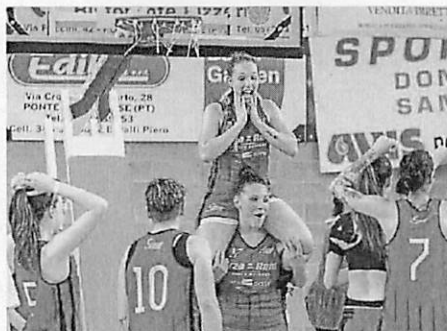
La gioia delle ragazze rosanero

Adesso, i meriti giusti per godersi l'entusiasmo e l'impresa, da condividere con tutto il territorio, e poi ci