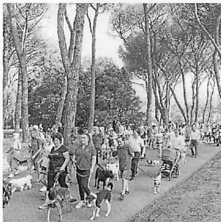
Un momento della sfilata del Dog Pride Day in Pineta