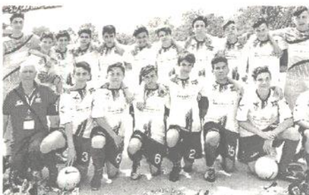
I Giovanissimi 2004 dell'Uc Via Nova

Ottimo risultato dei Giovanissimi 2004 alla manifestazione internazionale