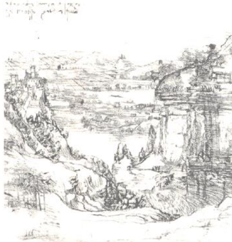
Il disegno di Leonardo da Vinci che raffigurerebbe la Valdinievole e il Padule