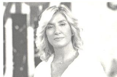
La giornalista Myrta Merlino conduce giornalmente la trasmissione «L'aria che tira»

« NON LASCEREMO solo Briganti - promette Merlino - casi come il suo, purtroppo, non sono degni di un paese civile. Ogni volta che ho dovuto affrontare situazioni del genere, sono tornata a parlarne in modo continuo per non fare calare il silenzio. Lo ribadisco, il nostro programma rimane al fianco di quest'uomo e torneremo a interessarci presto del caso».