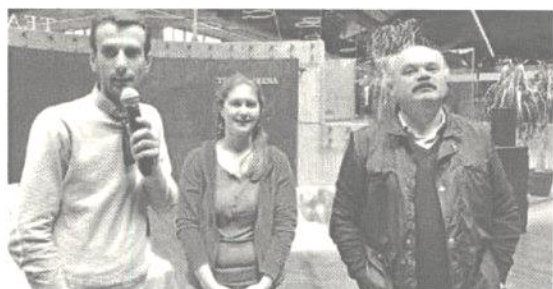
La premiazione del concorso fotografico con Oscar Farinetti (destra)

I RAGAZZI dell'istituto tecnico agrario Anzilotti di Pescia hanno partecipato alla premiazione del concorso fotografico «Il fiore: coltivato, spontaneo e reciso», organizzato in collaborazione con Flora Toscana. La premiazione si è svolta in un set d'eccezione: il parco agroalimentare di Bologna Fico Eatly World, la