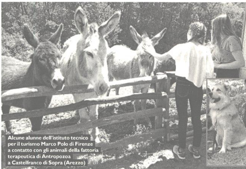
Alcune alunne dell'istituto tecnico per il turismo Marco Polo di Firenze a contatto con gli animali della fattoria terapeutica di Antropozoa a Castelfranco di Sopra (Arezzo)

MUGNAI ha ricordato che «spesso i cani di Antropozoa sono entrati nelle aule scolastiche o in ambienti comunitari e familiari difficili per stimolare, incoraggiare, migliorare la percezione del sé, tirare fuori emozioni spesso trattenute. In questo caso invece i cani sono entrati in un ambiente scolastico senza particolari problematiche emerse con la finalità di "mettere in azione" le risorse emotive, culturali, individuali di cui sono portatori gli studenti della scuola superiore: attraverso la presenza di un cane si possono sentire più motivati e incoraggiati nelle loro capacità emotive, attivando così risorse interne tali da modificare la percezione di sé rispetto all'altro, aumentare la motivazione all'apprendimento, collaborare in maniera attiva col il gruppo e incrementare la capacità di riconoscimento della propria posizione emotiva in un preciso momento».