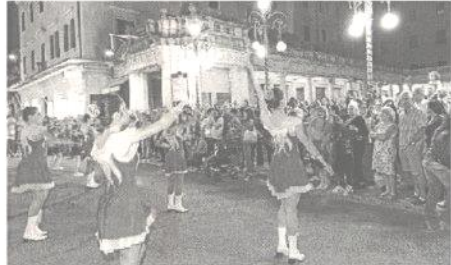
Alcune esibizioni delle majorettes davanti al Gambirinus

Le migliori ragazze tra le 200 circa che si sono esibite ai campionati tricolori sono sta-